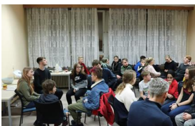
Gruppesamtaler: Spør om hva dere vil om troen. Etterpå ber vi sammen!