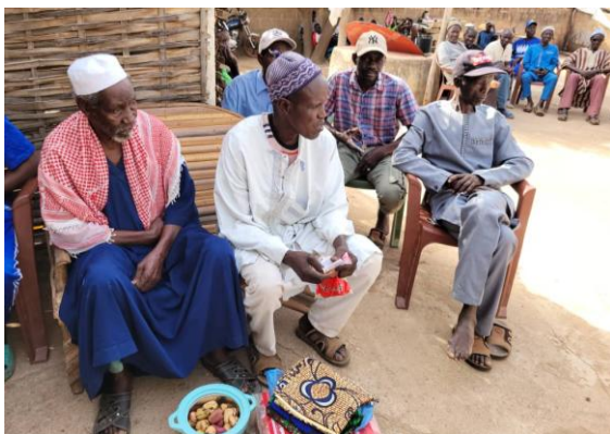
Tunet var fullt av menn fra familiene i landsbyen.

Dette er en del av det å være misjonær. Å leve tett på andre i landsbyen, delta i dåp, religiøse fester og begravelser, og å invitere andre inn i sine liv. Gjennom ulike markeringer deler de med stor frimodighet Guds historie, og hva Jesus betyr i deres liv.