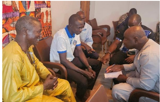
Ledere fra menighetene i samtaler på kirkemøtet

I Mali har den lutherske kirken, EELM, være registrert som selvstendig kirke siden 1992. Men kirken er fremdeles sterkt knyttet til misjonen. Det er mange avgjørelser som blir hengende i luften. Man avventer til neste gang Normisjons direktør kommer på et møte. Hva om jeg ikke kommer noen neste gang? Ennå i mars kunne jeg se for meg jevnlig reiser til Mali, nå er det vanskelig selv for maliere å forflytte seg rundt i landet. Nettmøter fungerer veldig bra med mine nærmeste medarbeidere, men de er ikke gode forum for samtale med en større gruppe.