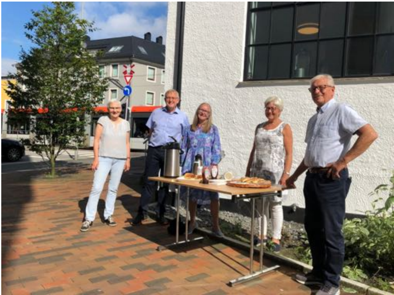
Formiddagskafé utendørs i Bjørnsons gate 11