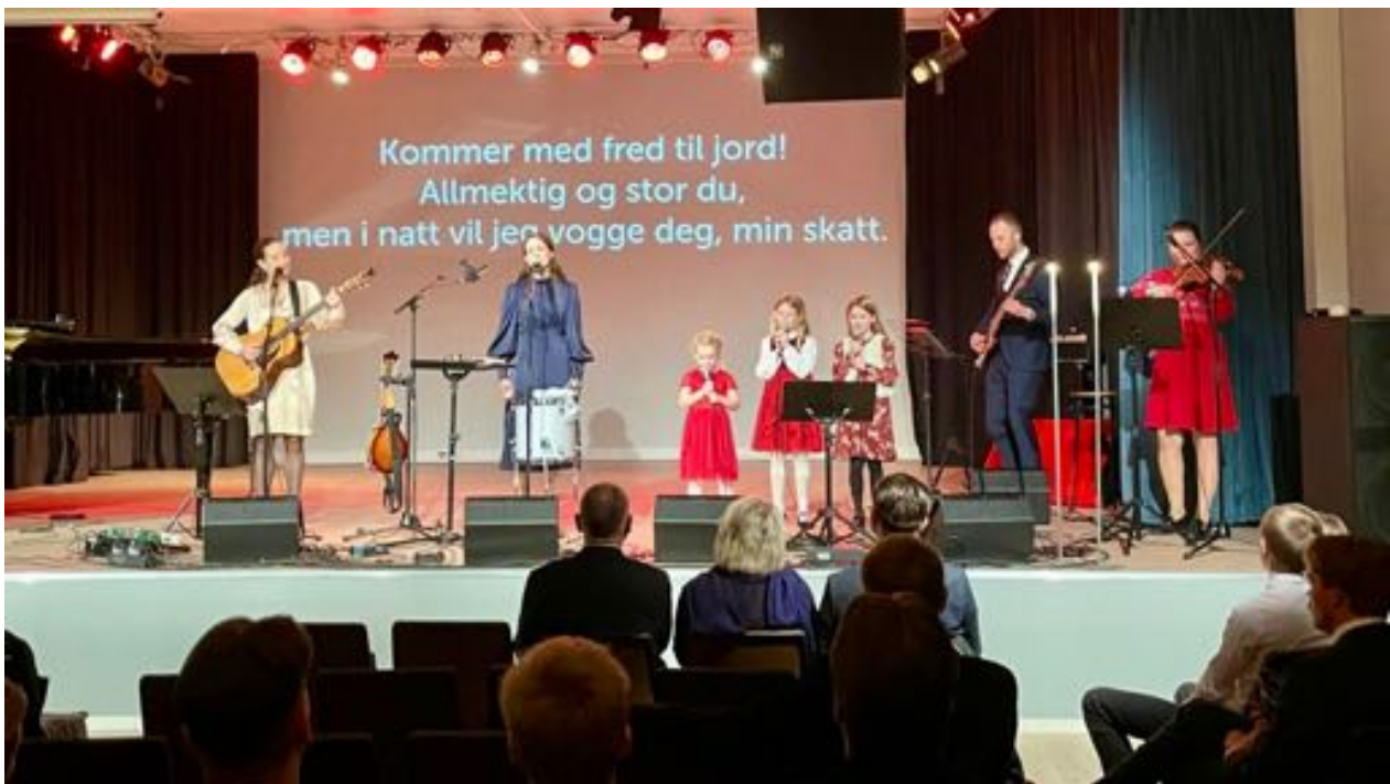
Julegudstjeneste i Norkirken Nordhordland

Menighetene i regionen er Norkirken Os, Norkirken Nordhordland og Norkirken Bergen. Dette er fellesskap som tar del i visjonen Jesus Kristus til nye generasjoner og folkeslag. Menighetene har gjennom året gudstjenester, kirkelige handlinger, husfellesskap, barnearbeid og bygger fellesskap som Jesus er en del av.