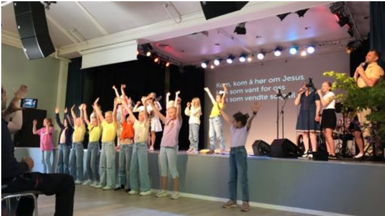
Pinsefest for alle på Nordhordland Folkehøgskule

Det er to søndagsskoler som hører til i Norkirkene i regionen, og disse er sammen med en gutteforening tilsluttet Acta Hordaland som barnelag. Disse barnelagene møtes ukentlig eller annenhver uke, og har andakt, misjonsfokus, hobbyaktiviteter, lek, spill og noen ganger måltid sammen.