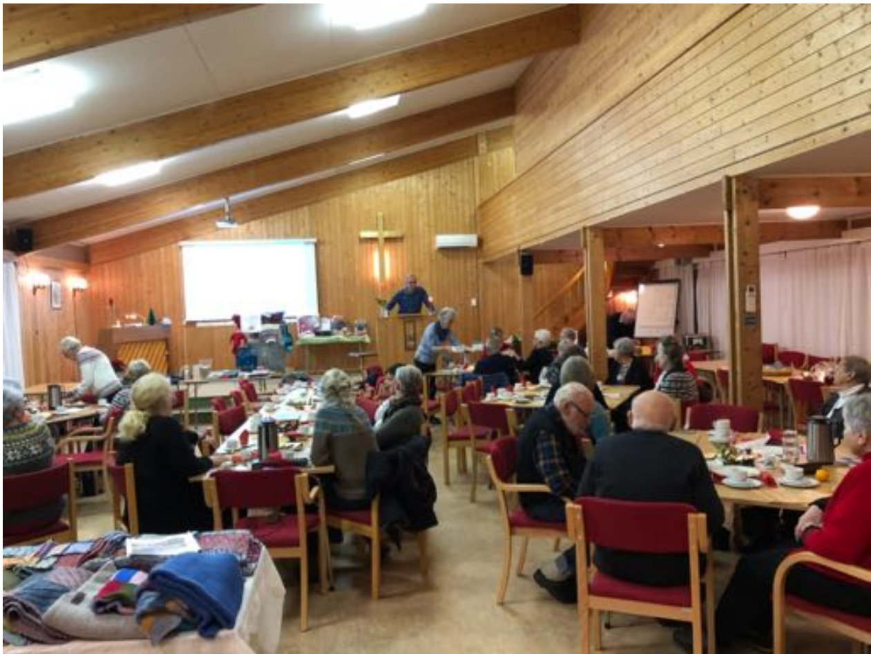
Basar på Tysnes