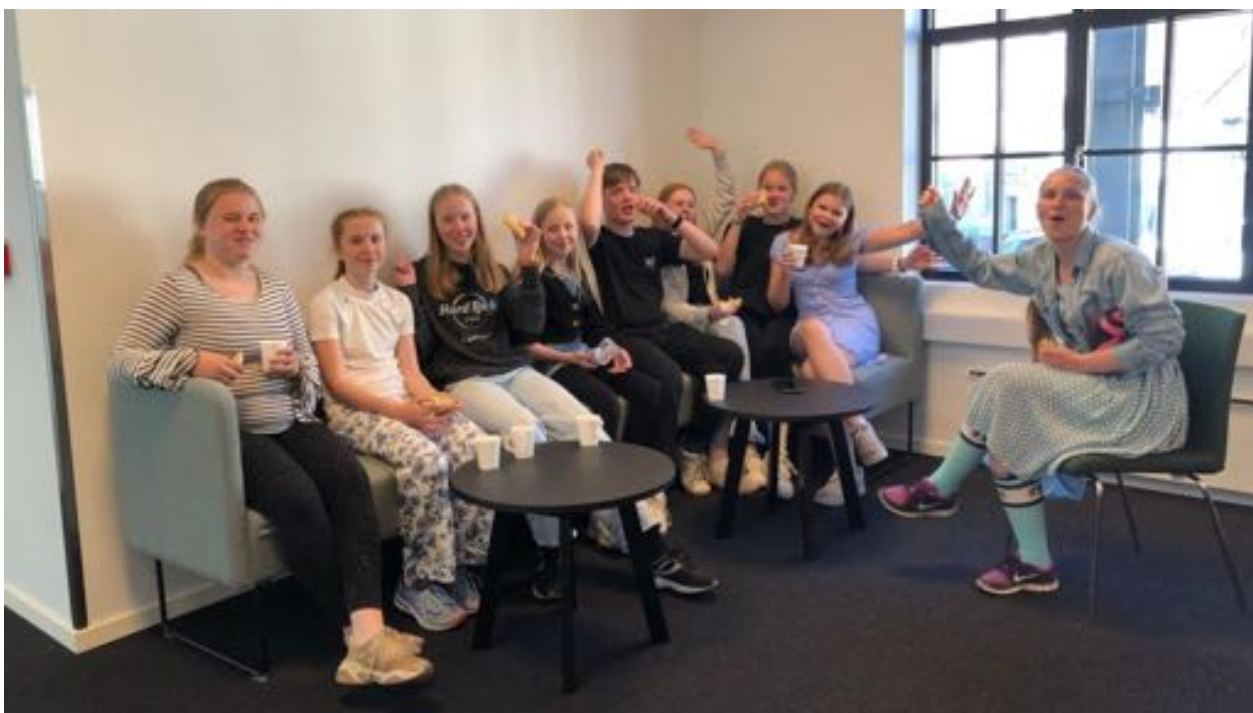
Bergen Soul Children har pause i øvingen

Tiden etter pandemien har vært krevende for arbeid blant barn og unge. Mange lag hadde lite virksomhet under pandemien, og 2022 var året da flere lag etter hvert var i normal drift etter år preget av restriksjoner. Noen lag har avsluttet virksomheten, mens det er gledelig at nye lag også har kommet til. Ved utgangen av 2022 var det 15 lag i Acta Hordaland, med rundt 265 registrerte deltakere. Det nye bygget i Bergen har gitt arbeidet et løft. I løpet av 2022 var det rundt 60 barn innom på de faste samlingene for barn.