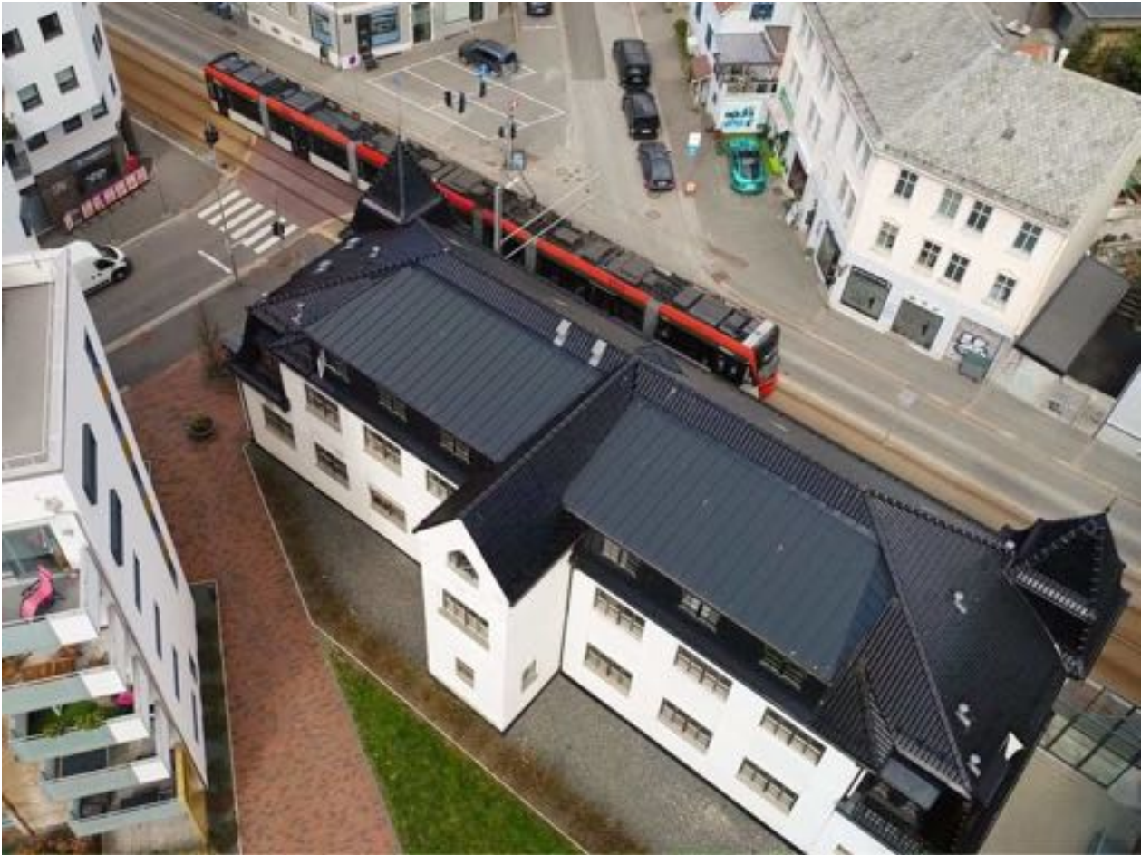
Kompagniet — Misjonscenteret i Bjørnsons gate 11 i Bergen

Region Hordaland er som kjent en region der ytremisjon har vært hovedfokus. Gaver har i stor grad blitt sendt direkte til hovedkontoret, gjerne merket med hva de skal brukes til. Dette har vi stor forståelse for, samtidig trenger vi midler til drift.