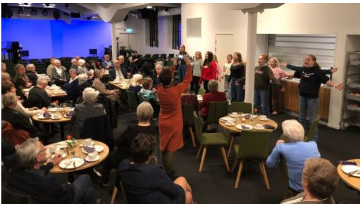
Medarbeiderfest for Galleri Normisjon. Bergen Soul Children sang.

Julesalget 2022 ble gjennomført i Bjørnsons gate 11. Mange deltok på julesalget. Styret har evaluert gjennomføringen og vil se på hvordan vi kan utnytte lokalene enda bedre. Resultatet ble veldig godt.