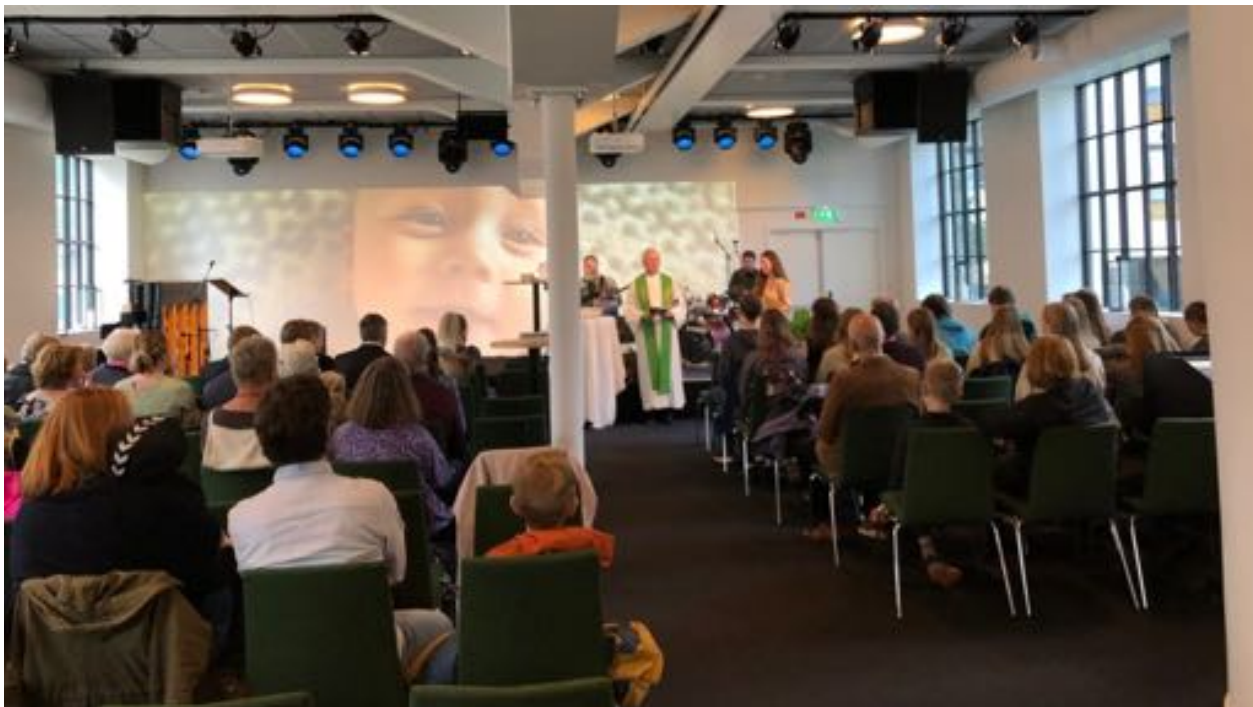
Dåp på gudstjeneste i Norkirken Bergen