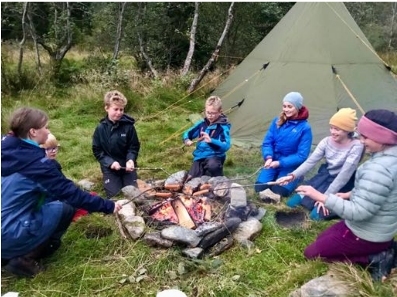
Tweensklubben i Norkirken Bergen på tur

Noen lokallag i Acta har arrangert egne turer og overnattinger. Blant annet har Arna Soul Children overnattet i kirken, og alle kormedlemmene kunne invitere med seg venner. Invitere venner kunne alle i Tweensklubben i Norkirken Bergen også. De dro på telttur, men måtte avslutte tidligere enn planlagt på grunn av mye regn.