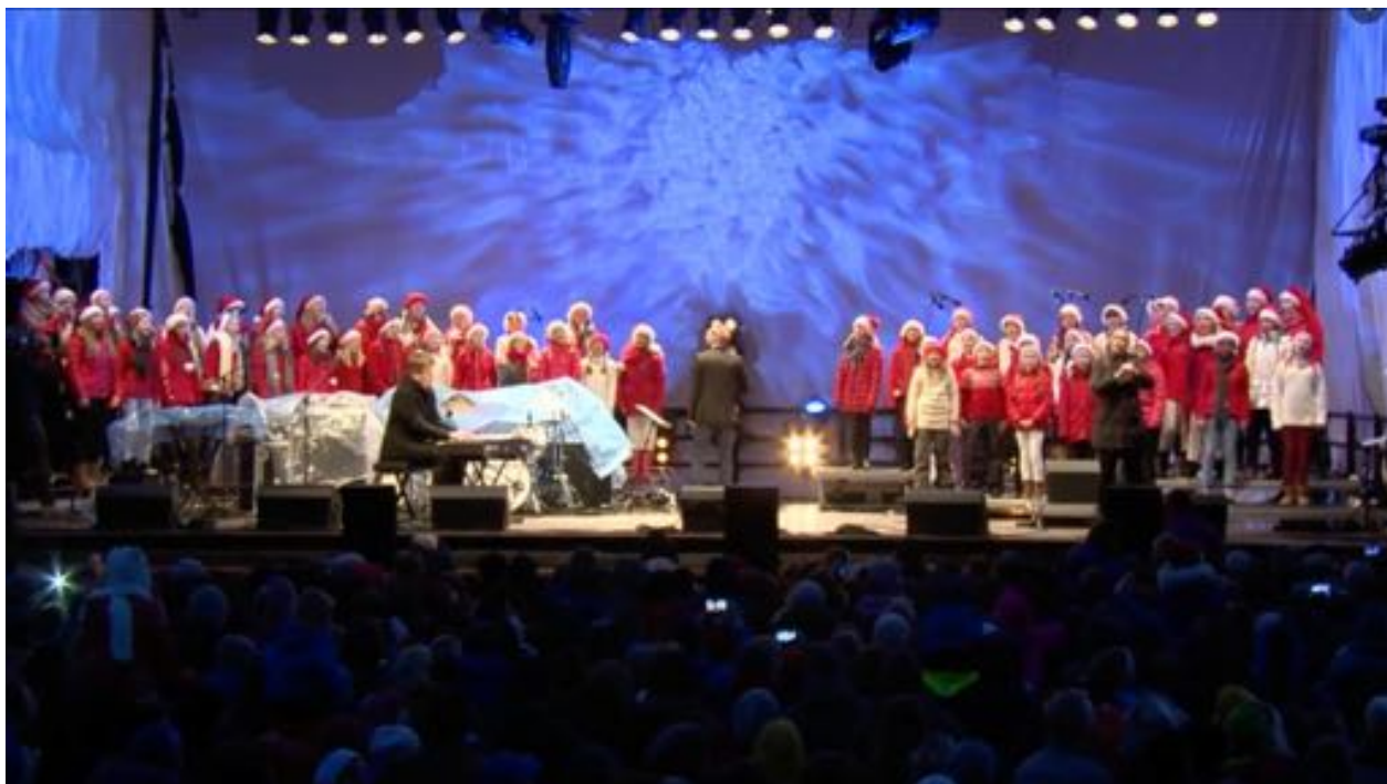
Arna og Bergen Soul Children sang på Lysfesten i Bergen

Soul Children-korene veksler mellom hverdag og fest. I det daglige er det øvinger med sang og koreografi, andakter og sosialt fellesskap. Dessuten bidrar de forskjellige korene på en rekke arrangementer i kirker og bedehus, på konserter og festivaler.