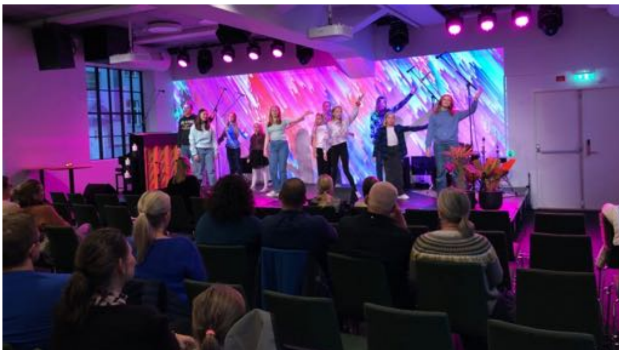
Bergen Soul Children har konsert