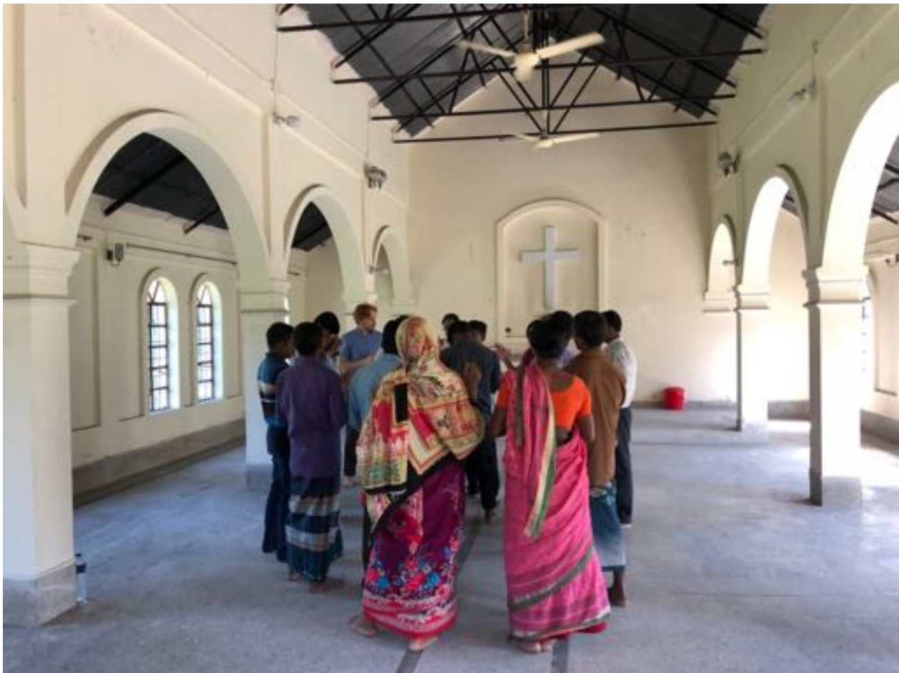
Agenda1 i Dinajpur, Bangladesh