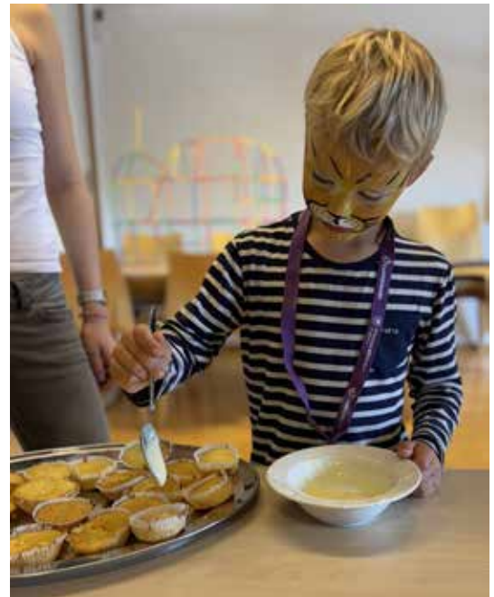
Baking er alltid en suksess.

Festivalen skal foregå i Norkirken Molde 7.-8 november. Dette er et samarbeid mellom Molde Bedehus, Norkirken Molde, Sion Molde,