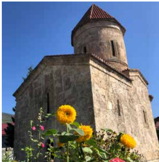
Kirken i Kish

Flere av de som har kalt oss «onkel» og «tante»