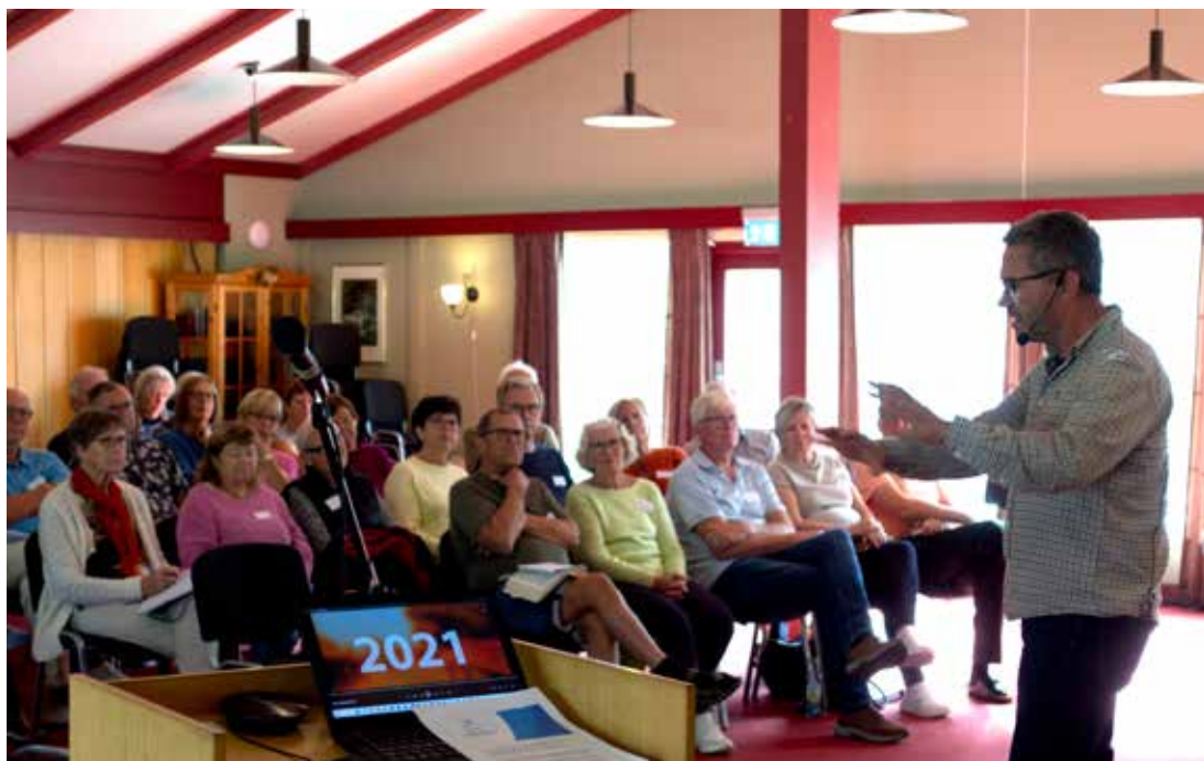
Rundt 70 deltagere var med på Bjorli-leiren, som varte fra 28-31. august.