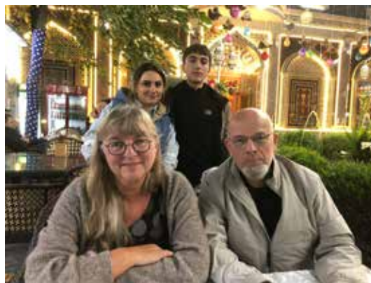
Ett av våre møter med venner

har giftet seg og selv fått barn. Dermed vokser antall familier vi er så heldige å få kalle våre venner.