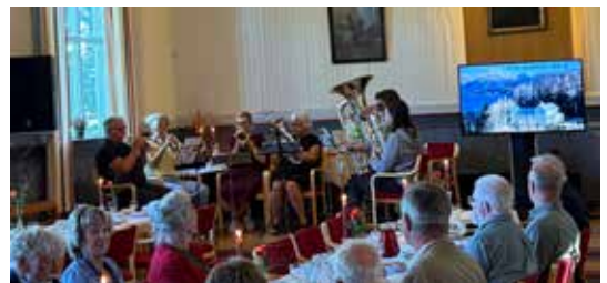
Frei Hornmusikk deltok på feiringen.