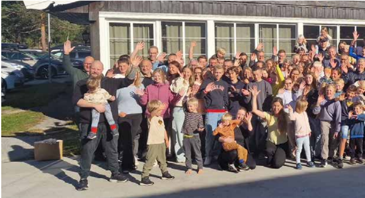
Det er alltid fulle hus på Familieleiren til Norkirken på Bjorli. Slik var det også i år.