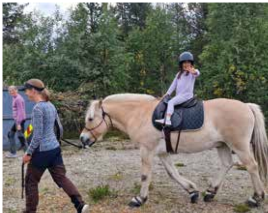
Noen får prøve seg på riding.