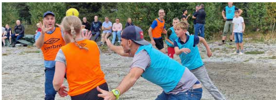
Action med ballspill.

Det var fullt hus og god stemning, da Norkirken arrangerte sin årlige familieleir på Bjorliheimen i september. Leiren er lagt opp slik at både voksne, ungdommer og barn får noe. Mens de sprekeste kom seg til fjells, var det aktiviteter for de som ville holde seg mer i lavlandet.