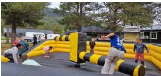
Mange aktiviteter for store og små på familieleir.