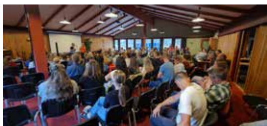
På møtene er det noe både for store og små.

Bjorli-leiren er viktig for, å kunne sveise Norkirken Molde enda bedre sammen. Samtidig er terskelen for de som ønsker å bli kjent med menigheten lav.