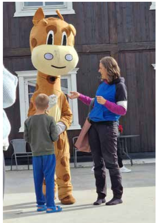
Giraffen er et morsomt innslag på møter og fritid.