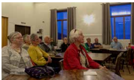
Det kom misjonsvenner frå alle øyane, då Normisjon heldt møte på Austnes i oktober.