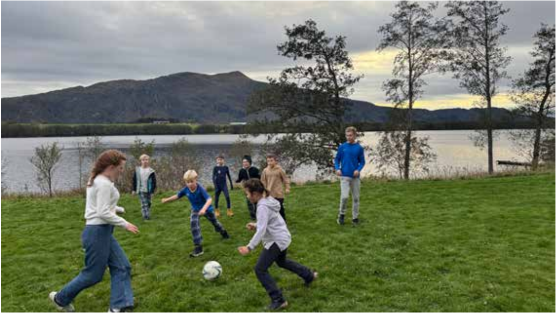
Fotballkamp på Frænabu. Imf-Ung og Acta arrangerte i høst barneleir for 1. til 4. klasse.

Som Acta ønsker å se helheten i arbeidet vi gjør med barn og unge, og vi ser viktigheten i å engasjere dem fra de er små, slik at det å være en velsignelse for andre og ha en naturlig del i Jesus. Og på denne måten er vi med å disippelgjøre dem ved å vise at Gud ønsker å ha med oss på det han gjør.