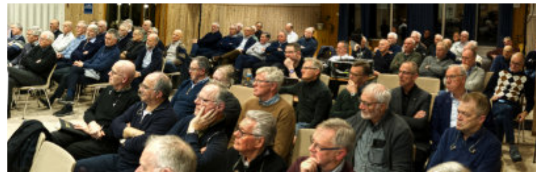
På enkelte møter var det opp til 70 mannfolk på det tradisjonelle Mannsmøtet på Brusdalsheimen.

at den kristne troa med en Gud som skaper og frelser omfatter et håp som er langt mer solid enn dagens moderne jag etter mening. Derfor skal vi med stor frimodighet bringe budskapet om Jesus utenfor de kristne forsamlingene. Han viste til flere pod-caster som tyder på at det er økende nysgjerrighet blant unge på hva Gud har å si til mennesker i dag.