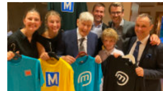
Norkirken markerte i 2025 sitt 20-års jubileum i Molde.