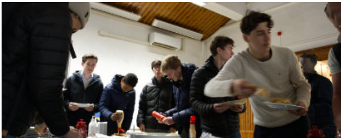
Norkirken Molde vil vise godhet ved å servere gratis Jesus-burgere, og elever strømmer til.

Flere ti-talls skoleelever snubler inn i Norkirken i Molde, der saftige karbonader og tilbehør venter på dem. Det er tid for Jesus-burgere.