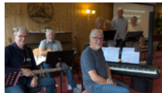
Bjorli-leiren er preget av mye sang- og musikk.