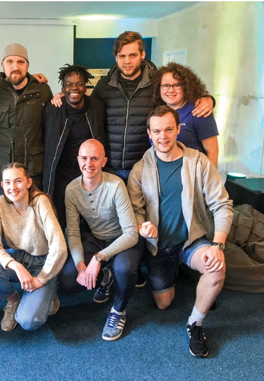
Teamdeltakere fra Agder sammen med bandet fra Danmark.

met ved siden av. I løpet av kvelden kom fem nye ungdommer inn for lange og dype samtaler, alle endte opp med å gi livet sitt til Jesus.