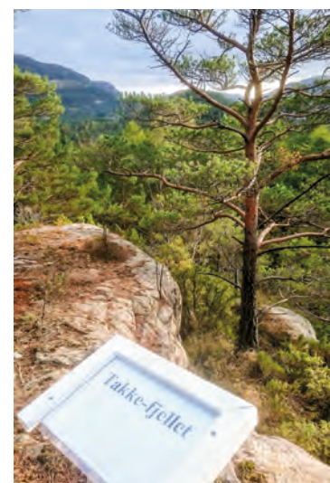
Fra bønnestien på Horve