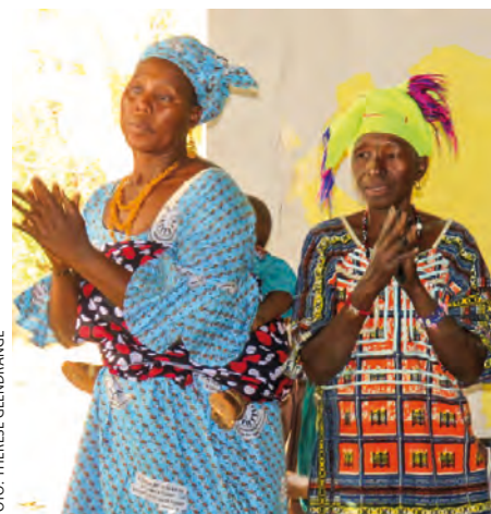
Det er mye dans og glede på Agenda 1-samling!

Mali Menighet og evangelisering i Mali Prosjektnummer 401 011