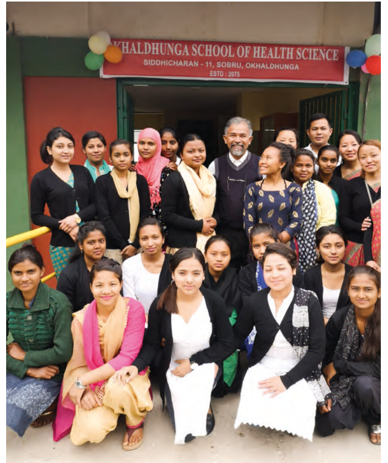
Elever og lærere ved den nye skolen på åpningsdagen.