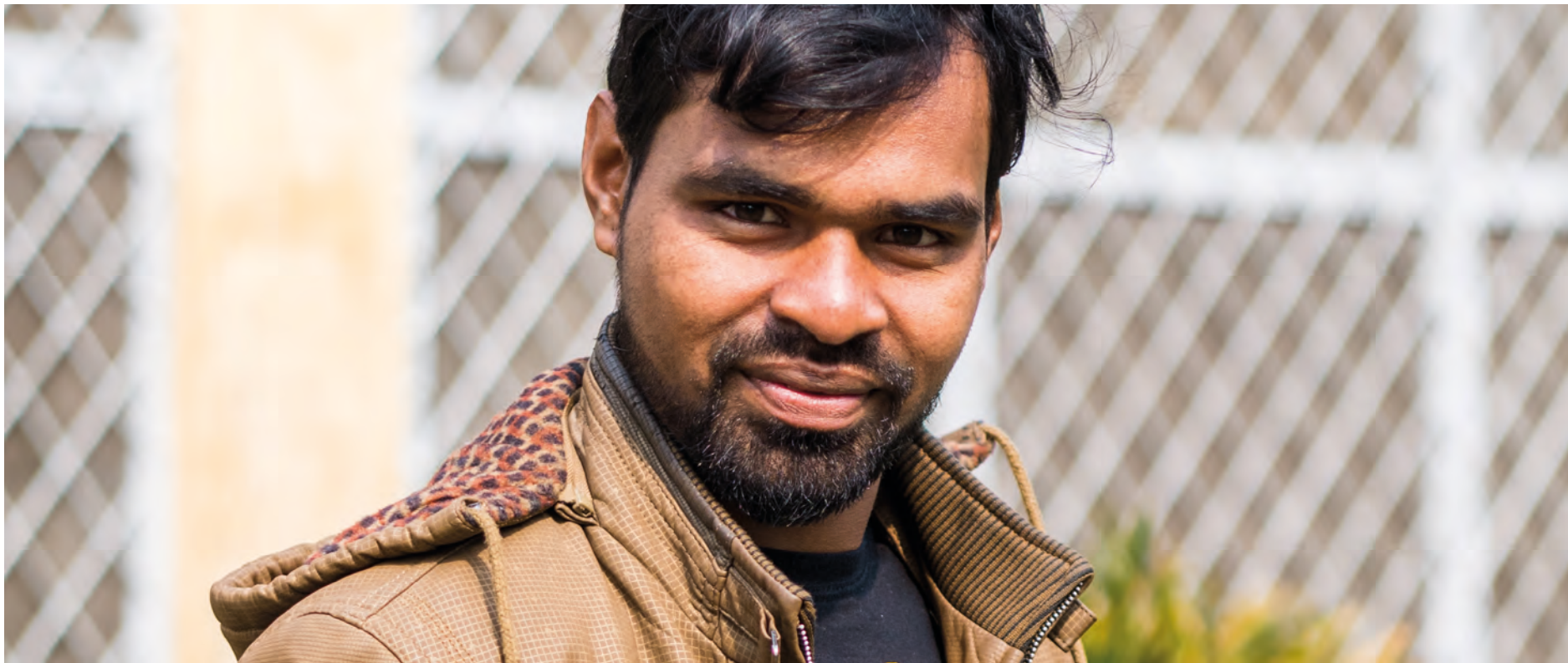
Bijoj er i ferd med å avslutte studiene sine. Han er takknemlig for mulighetene han har fått.