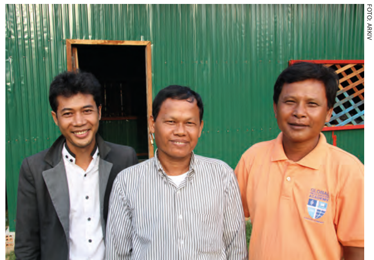
Huskirkelærere i Kambodsja.

Vær med å be om at huskirkene får være et sted der mennesker får kjenne fellesskap, vokse i tro og frimodighet til å tjene Herren.