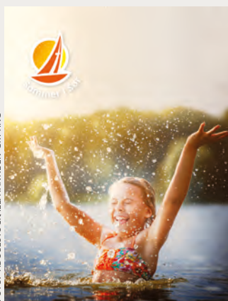
Sommer i Sør i Grimstad 9.-14. juli.

Du kan lese mer og melde deg på på www.sommerisor.no .