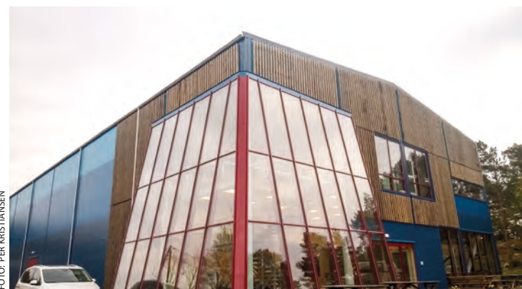
Risøyhallen - en moderne flerbrukshall