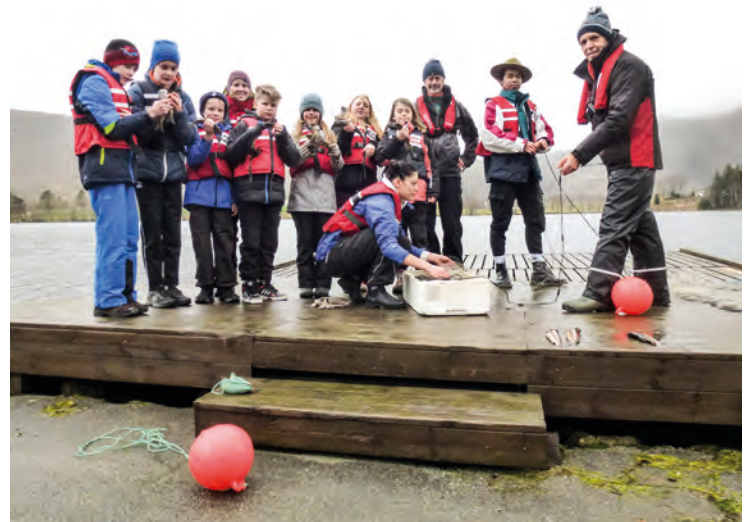
Fiske var en av mange aktiviteter på Anno 1950.

Temaet for leiren var «Skapt i Guds bilde» og all undervisning hadde dette temaet som utgangspunkt. Deltakerne fikk