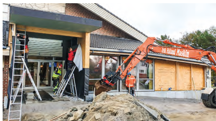
God dugnadsånd på Nærbø bedehus!

La oss be om at oppussingen av det 30 år gamle bedehuset vil hjelpe de til å oppnå det de ønsker: Gode fellesskap som samles om Bibelen.