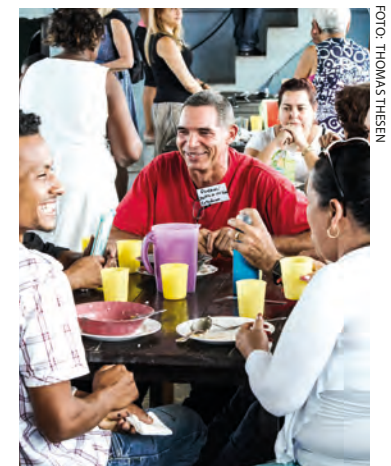
Agenda 1 fornyer våre søsterkirker – også på Cuba.

Det tas også nye steg ved at vi nå starter opp Agenda 1 i en ny by. Takk Gud for stegene vi får ta.