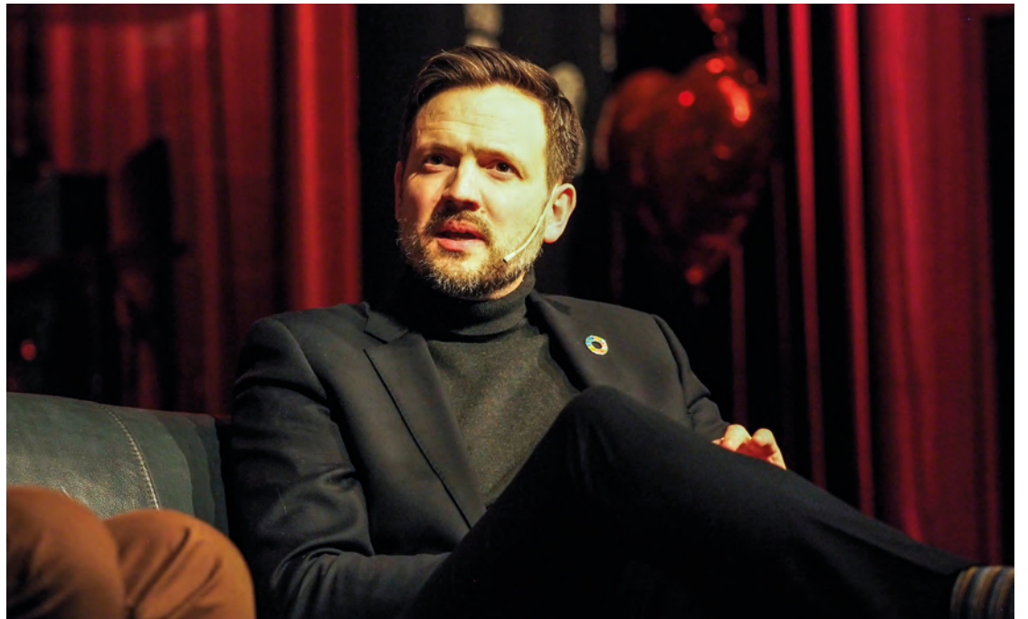
Utviklingsminister Dag Inge Ulstein deltok på Normisjons leder- og medarbeiderkonferanse i februar.