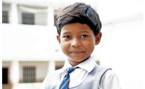
Utdanning er nøkkelen.

Den framvoksende Hindunasjonalismen i India gjør situasjonen vanskelig for mennesker som hører til andre religioner. Dette gjør arbeidet ekstra krevende, selv uten covid-19-pandemien. For Normisjon er det viktig å bidra til at kristne og andre ikke-hinduer får ivarett sine rettigheter. Prosjektet Like mye verdt med fokus på barn og unge, og særlig jenter, er derfor viktig.