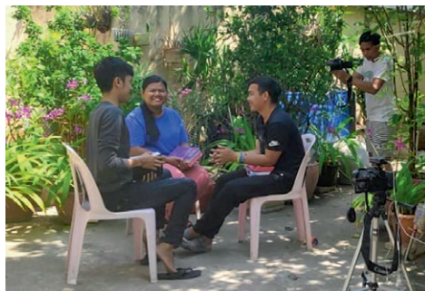
Opptak av vitnesbyrd for å sende på sosiale medier.

Lokale menighetsledere og pastorer, som har vært med på ledertreningen og Agenda 1-programmet for menighetsutvikling, kunne lede sine menigheter også i denne vanskelige perioden der vi ikke kunne reise fra Norge. Våre medarbeidere i Light of Life Church har vært til stor velsignelse i dette.