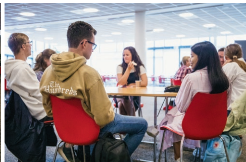
HLT Stavanger åpning 2020.