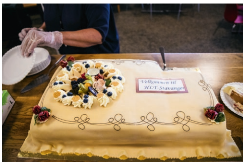
HLT Stavanger åpning 2020.