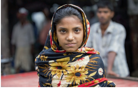
Like mye verdt.

Også Bangladesh er et muslimsk land med få kristne og åpen evangelisering tolereres ikke. Normisjon samarbeider med tre lokale kirkesamfunn i minoritets-folkegrupper. Vi ønsker å hjelpe disse kirkene til å være misjonale og bygge gode ledere.