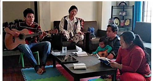
Gudstjeneste hjemme under pandemien.