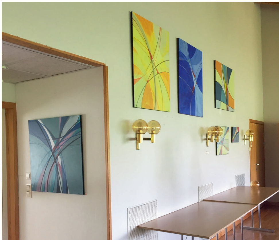
Fra kunstutstillingen på Hafrsfjordsenteret.

Tekst og foto: Hjørdis Halleland Mikalsen