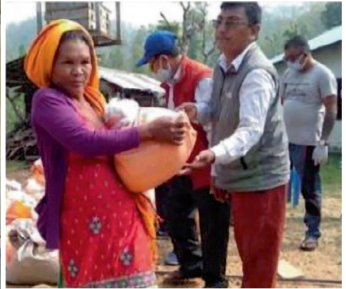
Matutdeling fra Sherpa-kirken.