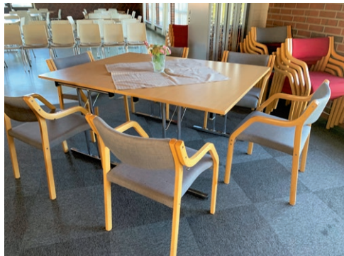
Damesamlinger med sprit og avstand.

Kvinneforeningene er fremdeles en viktig ressurs i misjonsarbeidet. Vi takker for forbønn, kreative gaveinnsamlinger og vilje til å ha fellesskap i en utfordrende tid!