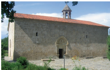
Kirken i Nich gir identitet til udi-folket.

Aserbajdsjan er på mange måter et lukket land for misjon og de kristne må være forsiktlige når de samles. Få menigheter er offisielt godkjent. Høsten 2020 brøt det ut krig mellom Aserbajdsjan og det kristne Armenia om det omstridte området Nagorno Karabach. Aserbajdsjan tok tilbake en stor del av området med støtte fra Tyrkia.