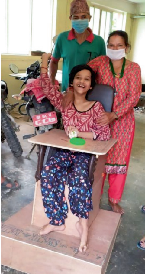
Å ha nedsatt funksjonsevne er vanskelig.

selv om det har vært sterke restriksjoner på reiser. Det er rapportert om flere nye døpte.