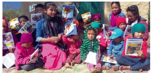
Barn i Sherpa-kirken.