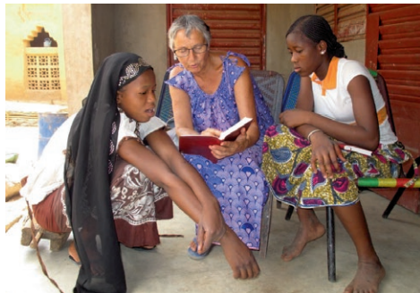
Bibelen på sitt eget språk.

Mali er et land med mange problemer: fattigdom, orken-spredning, islamistisk terror og politisk uro. Det gjør det vanskelig for folk, ikke minst de unge, å beholde håpet om en bedre framtid i landet sitt.