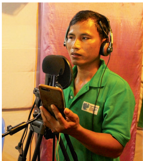
Innlesing av covid-informasjon på lokalspråk.