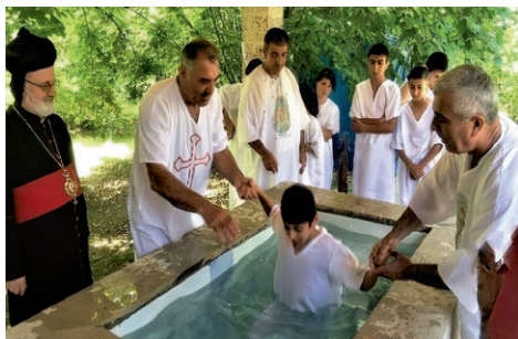
Dåp med neddykking i Udi-kirken i Nich.

Normisjon har lenge kunnet bidra mye til at sårbare grupper, som barn med nedsatt funksjonsevne, får