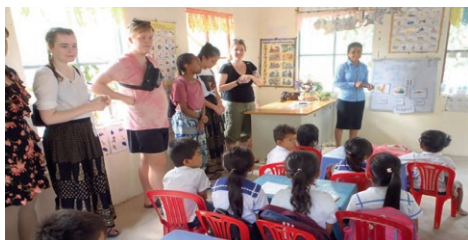
Å ta med foreldrene på førskole øker støtten til skolegang.

Region Rogaland har et spesielt ansvar for Normisjon sitt arbeid i Kambodsja. I hele 2021 kunne vi ikke reise til Kambodsja og det var fortsatt restriksjoner i forhold til å samle større grupper. Evangeliserings- og godhetsaksjonen måtte derfor avlyses. Men gjennom digital oppfølging og trofast arbeid av våre lokale medarbeidere, er mye godt arbeid gjennomført.