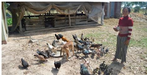
Mange har fått hjelp til kyllingproduksjon.