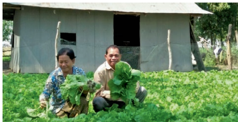
Familie gleder seg over nye produkter etter deltakelse i ICC prosjekt.