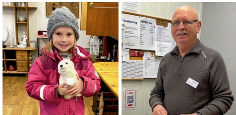
Fornøyd jente som kom i butikken ilag med bestefar og fant seg en hund.