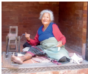
Håndverk er viktig i Nepal.