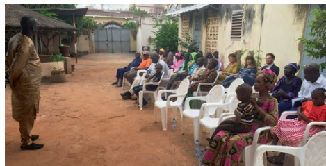
Det er godt å samles til gudstjeneste i Bamako.

Normisjon sitt pionerarbeid blant malinkéfolket i den sørløstlige delen av Senegal fikk en pause under pandemien, når misjonærene måtte reise hjem. Men fra sommeren var vi igjen på plass med tre barnefamilier;