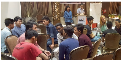
Studentfelleskapet i Dhaka i samtale om troen.

Også Bangladesh er et muslimsk land med få kristne. Normisjon samarbeider med tre lokale kirkesamfunn blant minoritets-folkegruppene. Vi hjelper disse kirkene til å være misjonale og bygge gode ledere.