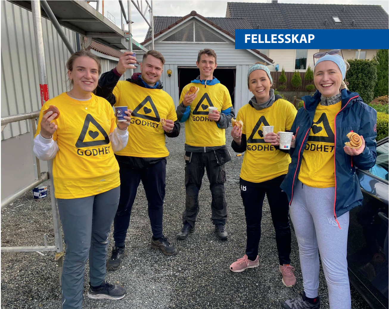
Norkirken Vigrestad velsigner mange med godhet.

vært et fast årlig innslag i mange år, også i pandemiårene. I år er det kommet inn rekordmange oppdrag, og mange frivillige stiller opp for å male, vaske, luke og rydde. Når ei ung alenemor kommer og spør om hjelp til å se på bilen som begynner å bli gammel, gjør det stort inntrykk å se gleden og lettelsen hennes over å få hjelp til noe som ellers ville vært en stor økonomisk utfordring. «Jeg skjemmes over å spørre, men jeg vet ikke hva jeg skulle gjort uten dere! Jeg er utrolig takknemlig. Tusen tusen takk!»