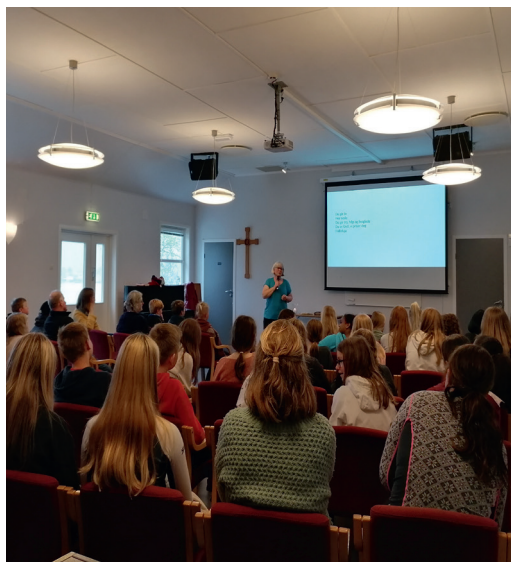
Mange gode samlinger på sommerfestene.