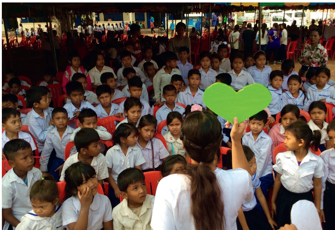
Guds hjerte er stort for Kambodsjas unge befolkning.