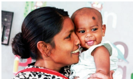
Å hjelpe foreldre til å ta godt vare på barna er viktig for Normisjon i Bangladesh

Bengalene er verdens største unådde folkeslag og Bangladesh er derfor fortsatt et viktig land for Normisjon. Normisjon samarbeider med tre lokale kirkesamfunn blant minoritets-folkegruppene. Vi hjelper disse kirkene til å være misjonale og bygge gode ledere. En ny norsk familie er på plass i Dhaka og arbeider strategisk for å nå mennesker og bygge mennesker gjennom ulike nettverk og menigheter.