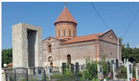
Myndighetene har restaurert en ny kirke for Udi kirken i Nich.

Normisjon vil gå ut av direkte eierskap og drift av prosjektene, men vil fortsatt støtte lokale drivere som kan føre prosjektene videre. Det betyr Folk Art, Heyat Resource Center, Udi kirken og et nytt prosjekt på menighetsutvikling. Et team fra Normisjon var i Baku i desember og gjennomførte en prøve på Agenda 1, som vi håper vil fortsette.