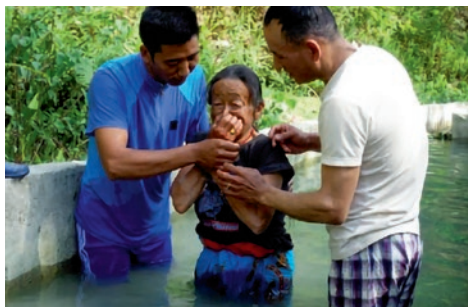
10 personer ble døpt i Okhaldhunga langfredag.

Elim School har klart å holde undervisningen gående også dette året, selv om ettervirkningene av covid-