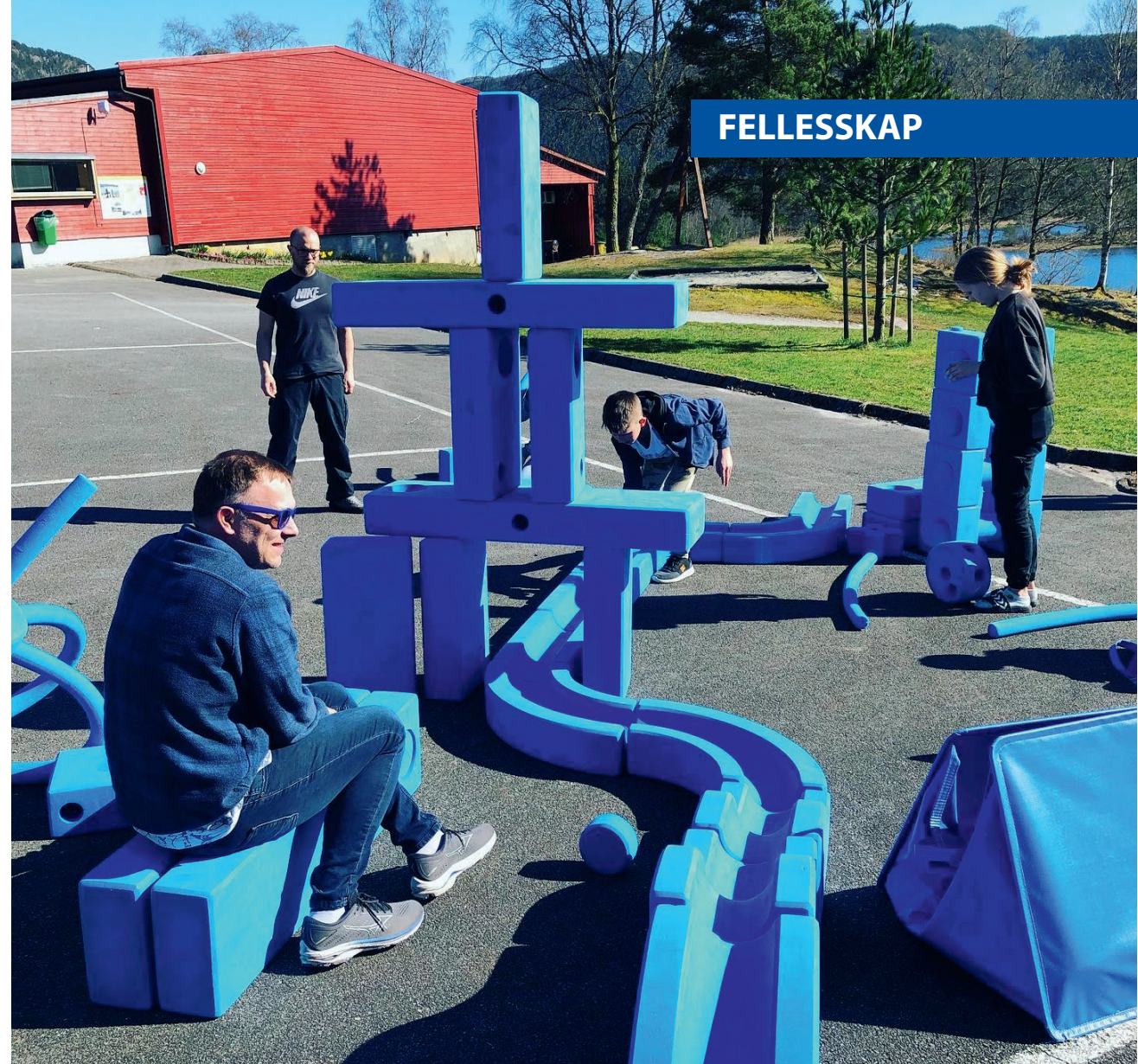
Barn, unge leirledere og voksne i felles lek på Horve.

som ledere på barneleirer. Mange leirsteder har vansker med å rekruttere nok nye ledere, mens vi kan glede oss over 96 på lederkurs nå i februar 2023.