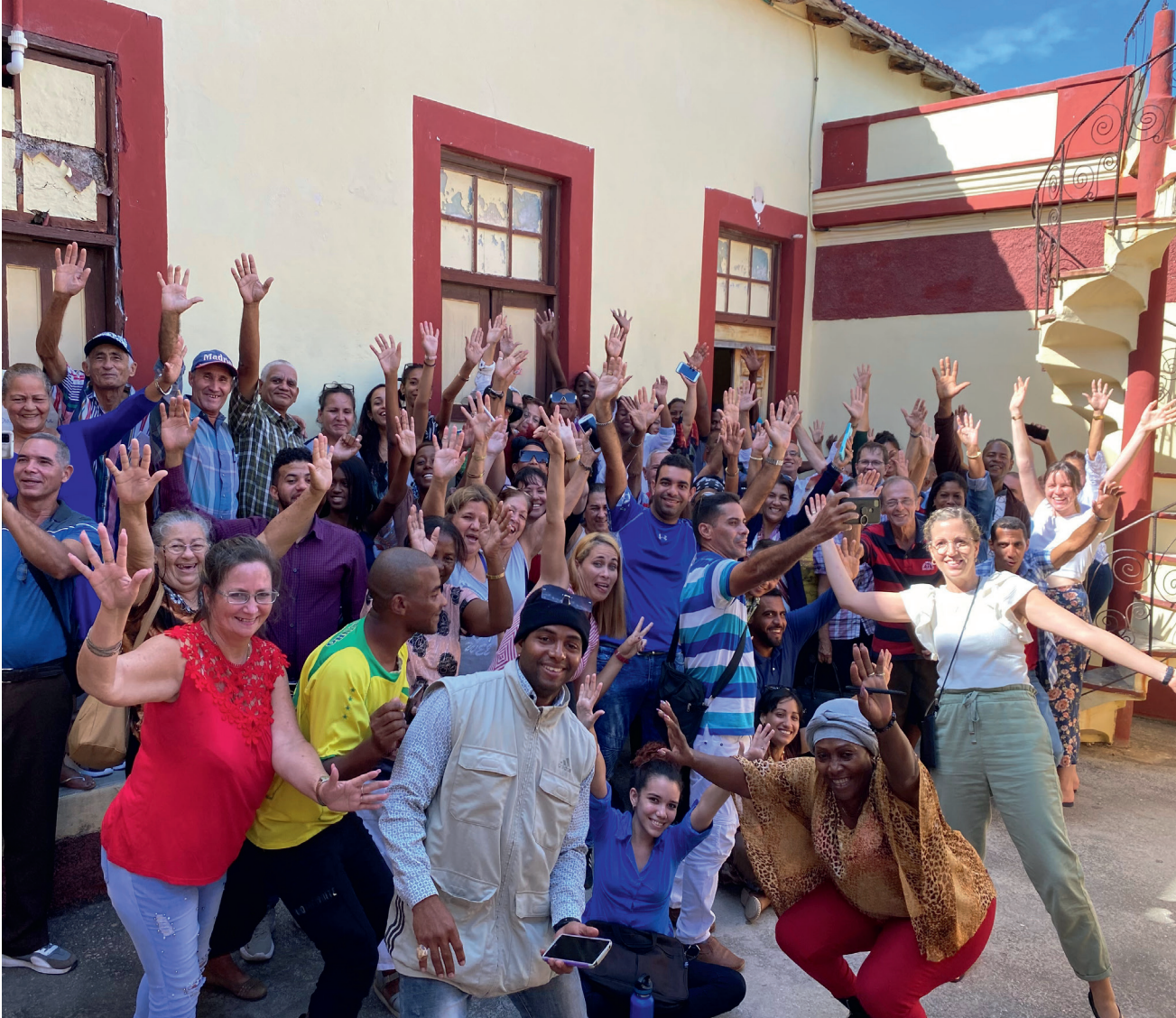
En flott gjeng med søsken deltar i Agenda1 på Cuba!

det som er tøft, men legger det ned for Hans trone og synger «Jesu Cristo basta», «Jesus Kristus er nok».