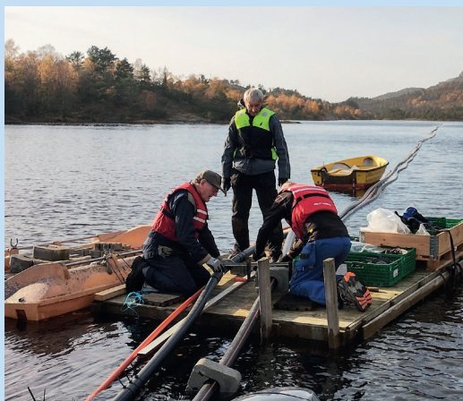
Ivrige montører på badeflåten.