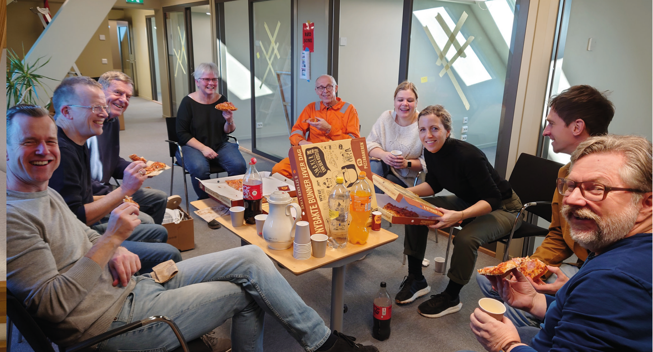
Her er noen av de som bidro på flyttedagen. Takk til gjengen fra IMI.