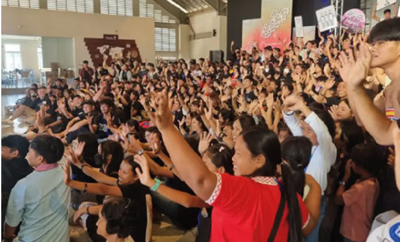
Begeistrede ungdommer på Impulssamling i Kambodsja.

bl.a. feilernæring og sult, redusert skolegang for barna, frustrerte foreldre som fører til vold og utrygghet i familiene, bortgiftning av altfor unge jenter (og også noen gutter).