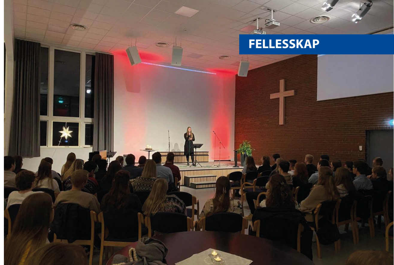
Unge voksne samla på Stemnestaden