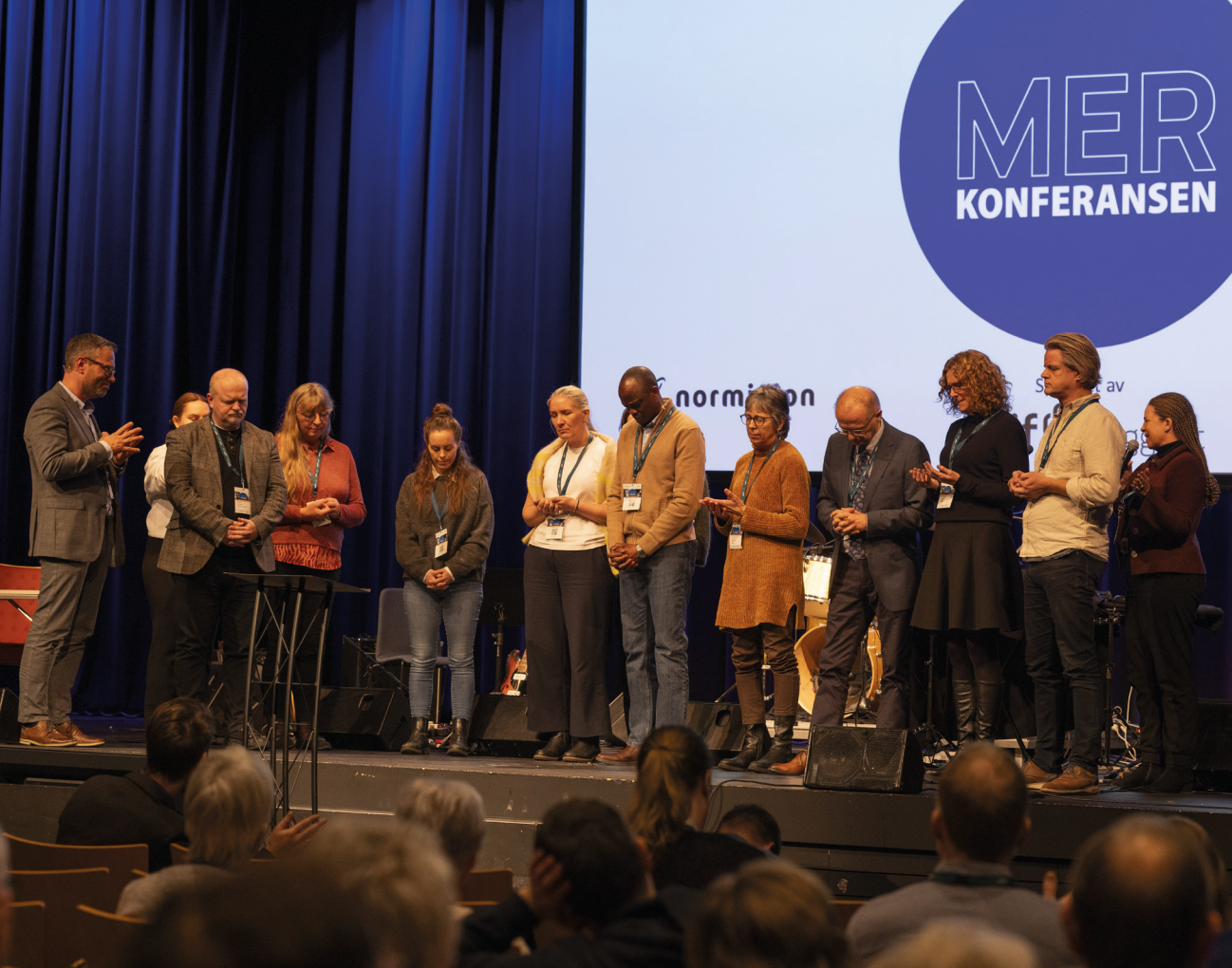
Forbønn for det nye landsstyret under generalforsamlingen.