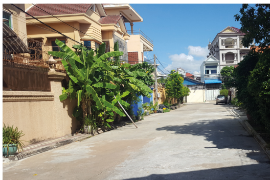
Det nye internatet ligger i en rolig gate i nærheten av det andre internatet.

Ut fra dette fellesskapet har LLC rekruttert de fleste medarbeiderne som arbeider i vårt kirkebyggende arbeid og på internatene. Vi er både imponert og takknemlige for denne flotte staben som tjener Herren og menighetene i Kambodsja med stor kjærlighet, visdom og engasjement. Det har de nå gjort i mange år med stor kontinuitet, og de har tatt over mange av de oppgavene som tidligere ble gjort av norske medarbeidere. Vi må fortsette å be om at de må få nåde til å fortsette sin gode tjeneste og være med på å forandre og skape vekst i menigheter over hele Kambodsja.