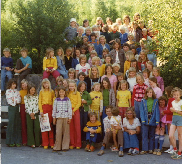
Leirbilder fra 1971 og etter fargefilmens tid. Noen som kjenner seg igjen?