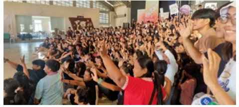
Mange ungdommer kommer på Impuls i Kambodsja.

De evangeliske aksjonene åpner for evangeliet i stadig nye områder og vi ser at ledertrening og Agenda 1 fortsetter å bygge sunnere menigheter som gir utrustning og vekst. Mer enn 200 nye huskirker ble etablert i 2023 for å følge opp de nye kristne i landsbyene. Vi øker fokuset på de unådde folkegruppene og 140 evange-