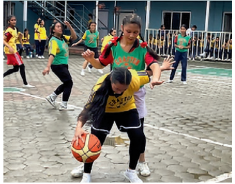
Idrett er viktig for skolemiljøet.

Prosjektet i Okhaldhunga som hjelper mennesker med funksjonsnedsettelse, har gitt mange et bedre liv og økt respekt i samfunnet. De har fått bedre helse, blitt mer økonomisk og politisk myndiggjort, og får tilgang til utdanning.