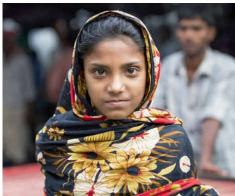
Yrkesopplæring gir jenter inntekt og verdi.

Mikrokredittvirksomheten som Viator driver, blir ikke påvirket av disse prosessene. Selskapet drives godt og gikk med overskudd også i 2023 og har nå ca. 60 ansatte, 5400 kunder og en utlånskapital på nesten 50 millioner kroner. I april 2024 feires 25-årsjubileum for denne virksomheten.