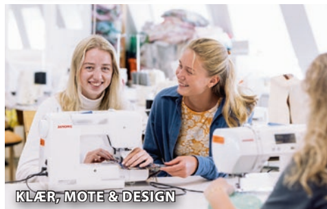
KLÆR, MOTE & DESIGN