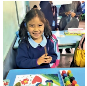
Første skoledag på Elim.

Høsten 2023 tegnet Normisjon en samarbeidsavtale med Elim School i Kathmandu. Vi ønsker å bidra til håp gjennom utdanning i Nepal. Elim driver en god skole, med kreativitet, pågangsmot og tillit til Guds hjelp. Prosjektet vil gi flere barn fra fattige familier mulighet til et bedre liv.