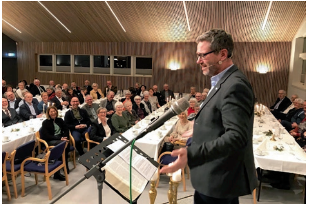
Inspirasjonsfest januar 2023.