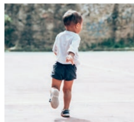
Trygg barndom gir et bedre liv.

Vi støtter arbeid for å hjelpe utsatte grupper til å få ivare tatt sine rettigheter (utdanning, helse og jord), redusere sosial undertrykkelse og å hjelpe dem med å øke sine inntekter, slik at de kan forsørge sine familier.