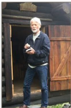
Andakt utenfor stabburet.