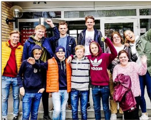
Acta-ungdommer og GUS-studenter på besøk på Danvik folkehøgskole.