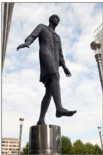
«Stepping Forward» av kunstneren Hanneke Beaumont utenfor bygningen til EU sitt ministerråd i Brussel.

Utenfor en av EU-bygningene i Brussel står skulpturen «Stepping Forward.» Skulpturen så jeg på interrail med en del Acta-ungdommer for noen år siden, og skulpturen har siden - med jevne mellomrom - dukket opp både i bevisstheten min og i andakter jeg har holdt.