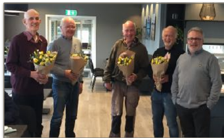
Strandstyret ble takket for innsatsen gjennom flere år på en tilstelning på Strand i mai. Tre av styremedlemmene var ikke tilstede, og vil få takk og blomster siden.

Forslaget fra regionstyret var at styret skal erstattes av prosjekt - og ressursgrupper etter behov. Regionstyret drøftet disse innspillene på sitt første styremøte etter årsmøte. Styret er fremdeles av den oppfatningen at driften av Strand fremover vil være mer tjent med ressurs - og prosjektgrupper, samtidig ønsker styret å jobbe mer med hvordan dette skal løses. Det er blant annet viktig med tydelige mandat til slike grupper. Styret vil også ta med flere på råd, før man vedtar en endelig organisering av Strand.