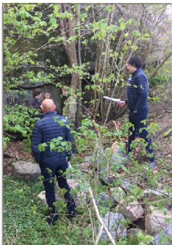
Oppmåling av Villatomta ble foretatt nå i mai og krever en ny behandlingsrunde i kommunen.

I slutten av november 2018 ble reguleringsplanen for Strand endelig vedtatt i bystyret i Sandefjord. Dette vedtaket var en forutsetning for kjøpekontrakten for Villatomta som vi undertegnet med kjøper i april 2018. Kjøpesummen, som mange er kjent med, er for Villatomta på kr. 5,2 mill. Oppgjøret skal betales i to rater á kr. 2,6 mill., der den første skal betales så snart nytt skjøte for tomte er klart. Denne prosessen hadde regionstyret god grunn til å tro skulle sluttføres i løpet av februar/ mars i år, og med bakgrunn i dette vedtok styret at man kunne forskuttere kr. 650.000,- til oppussingen av Strand i påvente av at salget av Villatomta skulle bli klart.