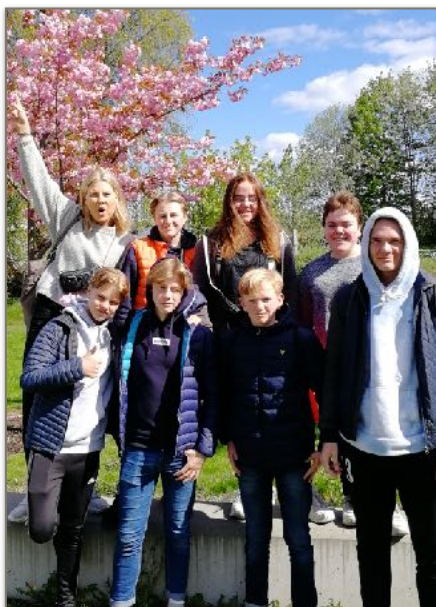
Ungdommer på teamsamling i Drammen