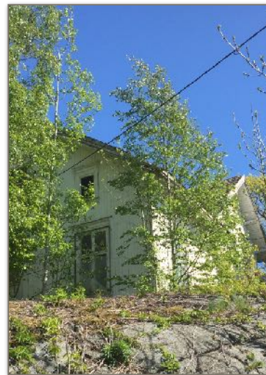
Villatomta ble solgt i fjor, men salgsoppgjøret tar tid.

Det er god kontroll over regionens samlede utgifter. Strand har en utgiftssprekk i forhold til budsjett, men ligger bedre an sammenlignet med regnskapstallene for samme periode i fjor. Vi ser at det fremdeles vil ta tid å snu minustall til plusstall for Strand, men utviklingen går rett vei. For de to