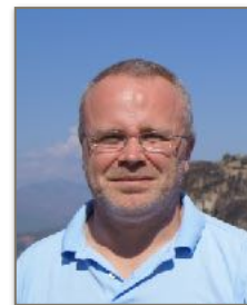
Betraktningen over Matteus 14, 22-33 er skrevet av Svein-Tony Gårdsø

La oss - som Peter - våge å gå når Jesus kaller oss. Tro er kanskje å miste fotfestet for en stund, i alle fall kan det føles slik. Men tro er også å få et håndfast bevis - slik Peter fikk - på at Jesus holder oss oppe. Når han ber oss komme så har vi også hans løfter om at han går med oss.