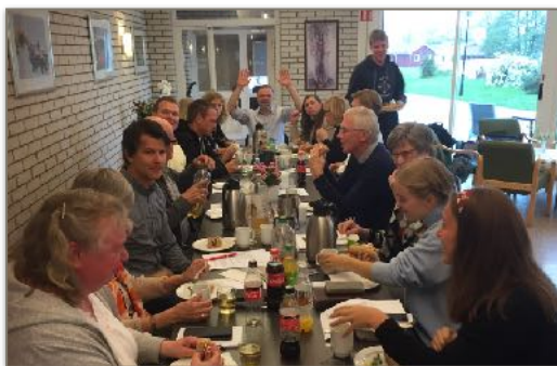
Gjennestad vgs, Norkirkene, GUS, hovedkontoret og den regionale staben på felles stabsdag der tema var Normisjons internasjonale arbeid.

- om å gi mennesker evighetshåp og hverdagshåp