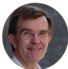
Oskar Skarsaune «Etterlyst: Bergprekenens Jesus. Har folkekirken glemt ham?»