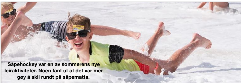
Såpehockey var en av sommerens nye leiraktiviteter. Noen fant ut at det var mer gøy å skli rundt på såpematta.

ÅPNINGSTID: LØRDAG 28. SEPTEMBER KL.10.00 - 15.00