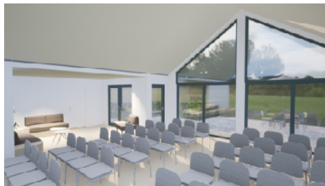
Nytt forsamlingslokale. Innvendig. Østvendt.

Arbeidet på Strand har alltid vært båret frem av engasjerte mennesker. Nå har vi nok en gang et prosjekt som utfordrer alle oss som brenner for Strand og som ønsker at leirstedet også skal være et godt og samlende sted for kommende generasjoner.