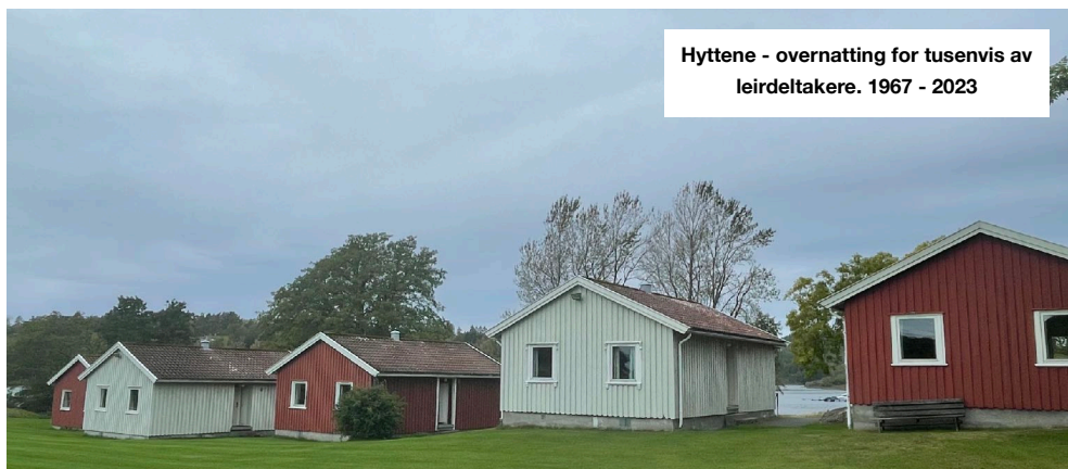
Hyttene - overnatting for tusenvis av leirdeltakere. 1967 - 2023