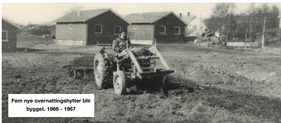
Fem nye overnattingshytter blir bygget. 1966 - 1967