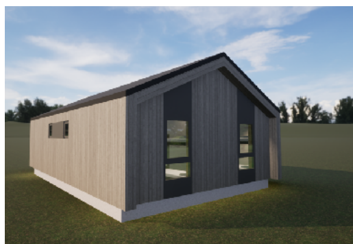
Hytte 2-4, sørvest. Hyttene beholder dagens størrelse.

Dagens hytter er på 60 kvadratmeter. Fem nye og større hytter, vil bli et for stort økonomisk løft å bære i årene fremover. Regionstyret har derfor vedtatt en renovering av fire av de fem hyttene. Dette vil svare på det behovet vi har i dag for flere rom med bad, og det vil gi oss det vi trenger for en god drift fremover.