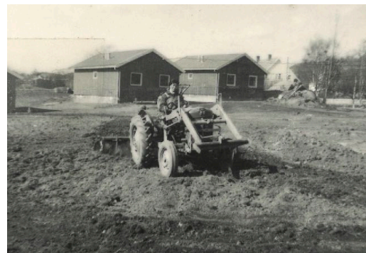
Bilder fra byggearbeidet i 1967.