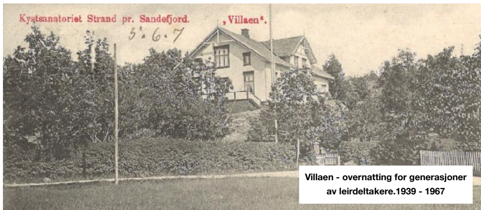
Villaen - overnatting for generasjoner av leirdeltakere. 1939 - 1967