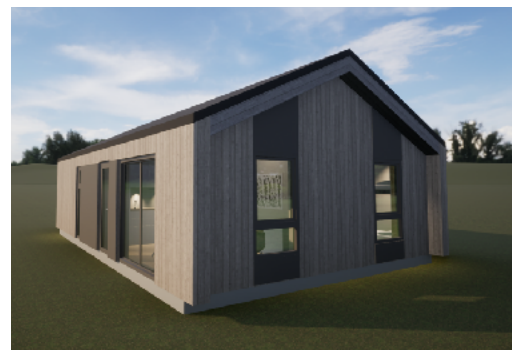
Hytte 5, sørvest. Tanken er at denne hytta skal få større vindusflater. Den vil også skille seg ut fra de andre ved at den får tre soverom + ett mindre oppholdsrom.

Dusjbygget slik det er i dag vil bli overflødig når hyttene får toalett og dusj på alle rom. Planen er derfor at dette bygget bygges om og brukes til garderobe, kjøkken og toaletter i tilknytning til den nye møtesalen. Får vi dette godkjent får vi et langt mer fleksibelt leirsted for fremtiden. Med ny møtesal og fire renoverte hytter får vi muligheten til å ta i mot mindre grupper som vi i dag ofte sier nei til. Stadig får vi spørsmål fra Actalag som ønsker å klare seg selv en helg. Med