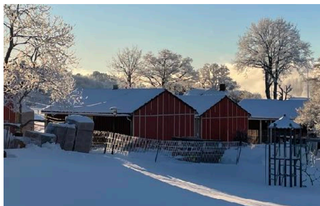
Arbeidet med å renovere flere av hyttene startet i november og byggeprosjekt 1 (renovering av tre hytter) vil være ferdig i juni i år.

nærmer oss, og har troen på at vi skal lykkes med balanse i 2024. En bærekraftig økonomi, der ekstraordinære gaver kan brukes til å investere i f.eks. nybrottsarbeid, vil gi oss muligheten til å