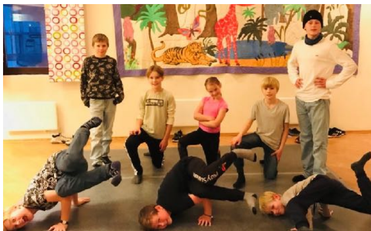
Breakere i Norkirken Drammen.

I Norkirken Drammen og Norkirken Sandefjord skjer det virkelig noe spennende. Acta, i samarbeid med disse Norkirkene, går nå inn i det tredje året med breakdance-tilbud for barn og unge tilknyttet disse to menighetene. Dette unike tilbudet består av deltakere blant både gutter og jenter og vi opplever at breakdance i kirken appellerer til en bred gruppe barn og ungdommer.