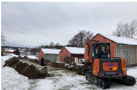
Det legges nytt avløp, vann og strøm inn til hyttene.

Vi er nå i gang med å montere vann og avløp, samt strøm og sikringskap inn