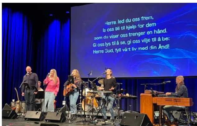
Rundt 500 deltok på MER-konferansen. På Normisjons Generalforsamling som ble gjennomført i løpet av MER var det i underkant av 300 delegater.

Det har vært jobbet mye med Normisjons strategiplan. Det er gjort et omfattende