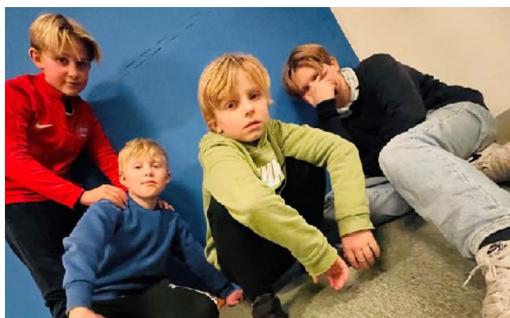
Breakere i Norkirken Sandefjord.

Breakdance-tilbudet i Norkirkene fungerer som et fantastisk supplement til kirkens øvrige aktiviteter. Det har blitt en plattform der barn og unge ikke bare kan utvikle sine ferdigheter innenfor dans, men også bygge relasjoner og oppleve fellesskap på tvers av tradisjonelle grenser. Acta, i samarbeid med Norkirken Drammen og Norkirken Sandefjord, har sammen skapt noe unikt som ikke bare beriker menighetene, men som også engasjerer og inkluderer ungdommer utenfor kirkens ordinære fellesskap.