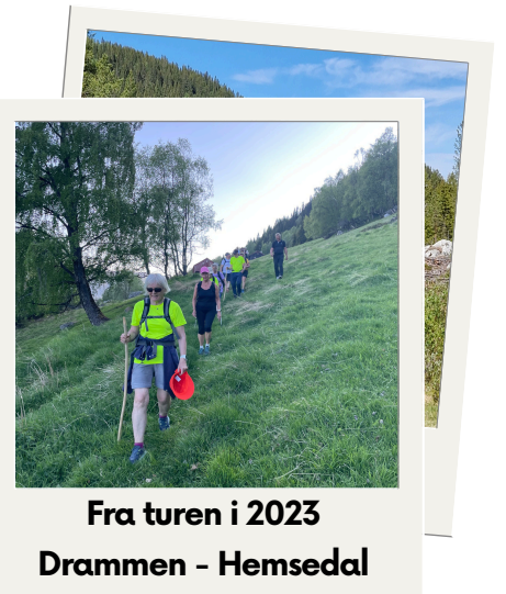
Fra turen i 2023