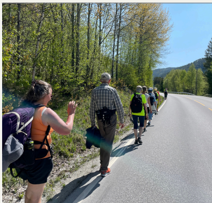
Fra turen i 2023 Drammen - Hemsedal