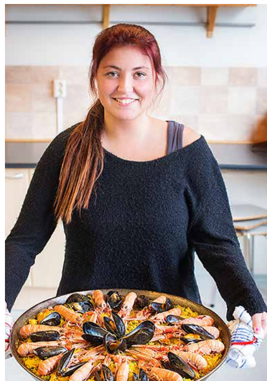
Lisell som viser fram paellaen

På skolekjøkkenet har vi gjerne tre valgfag, middelhavsmat, mat på fat og bak og smak. På bildet ser vi paellaen som lærer Sakis har lært elevene å lage. Paella er en spansk rett som oftest inneholder både kylling og sjømat. Selv om noen er skeptiske til sjømat, er det alltid morsomt å smake noe nytt. I paellaen er det både kreps, blåskjell og reker. I tillegg er det ris med safran som gir den fine gule fargen. Sakis stiller gjerne med egen paellapanne som han har med hjemmefra. Den er kjempestor, og har plass til mat til hele gruppa, selv om det godt kan være 10 elever. Det er bare å spise, og restene er det alltid noen andre som har lyst på!