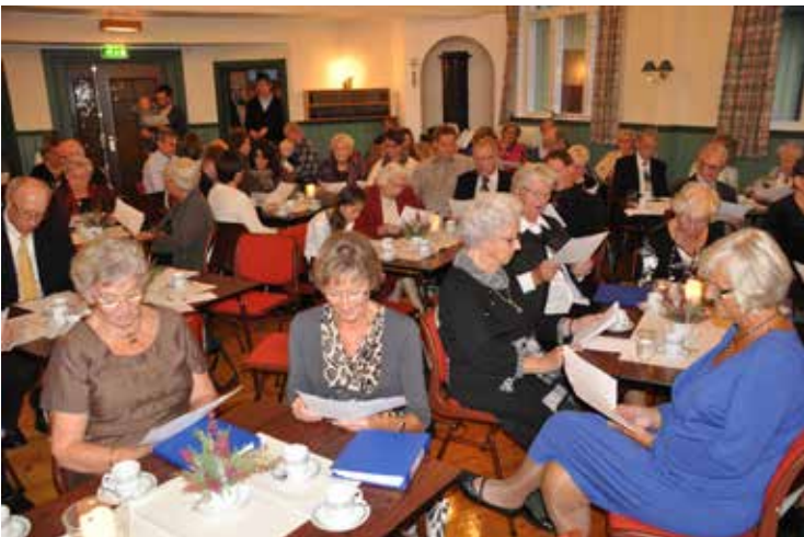
Arbeidet i Østfold preges av mange trofaste foreninger, som her i Pella, Tistedal, som jubilerer i fjor.