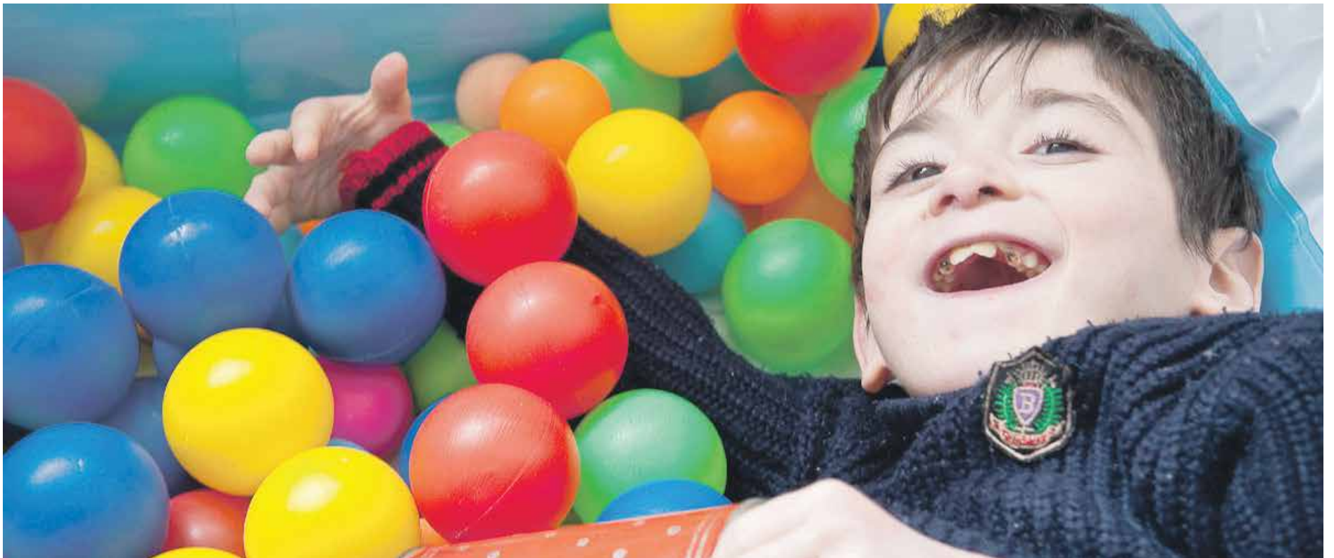
På dagsenteret Heyat i Aserbajdsjan møter denne gutten forståelse og ikke fordømmelse.