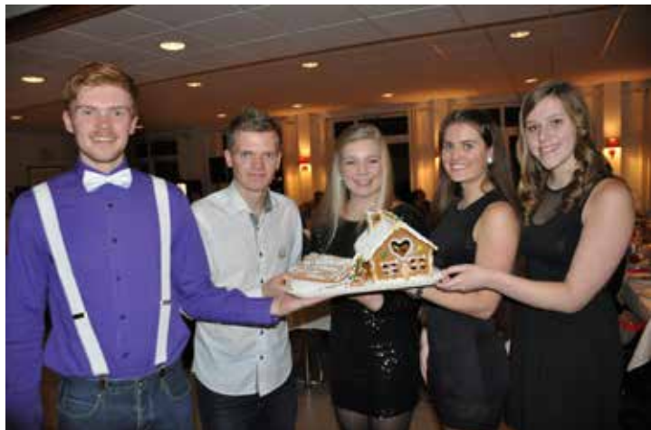
Under julemiddagen ble Haugetuns fineste pepperkakehus kåret

som i himmelen», og det er jo nettopp fordi det ikke er Guds vilje alt som skjer på jorda, i vår hverdag. Det er viktig å formidle at vi skal slippe å forsøke å finne en Guds vilje med alt det meningsløse og onde som skjer i verden! Men be om hjelp og styrke fra Gud kan vi i hvert fall gjøre under alle livets forhold.