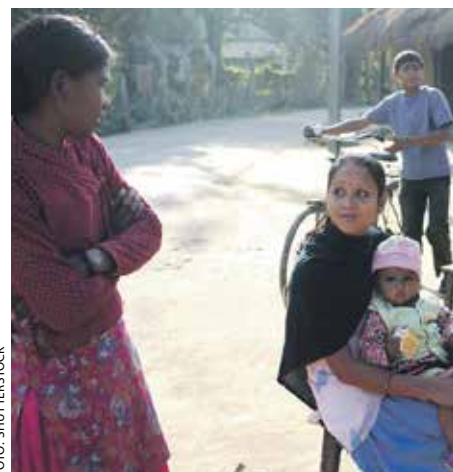
I Bhutan er det fortsatt mange som ikke har hørt om evangeliet.