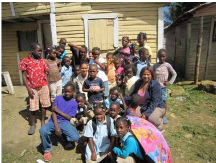
Her er noen av barna som elevene møtte i fjor