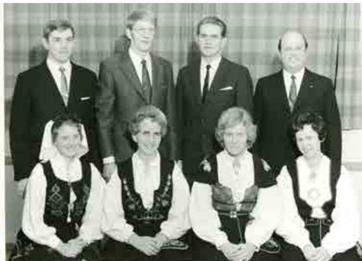
Ungdomskomiteen i Vestre Østfold Indremisjonskrets 1972 - 1973