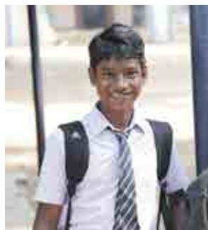
Større plass for elevene.

Elevtallet ved Don Bosco School har steget hvert år. Dette er selvsagt gledelig, men i flere år har også skolen slitt med dårlig plass.