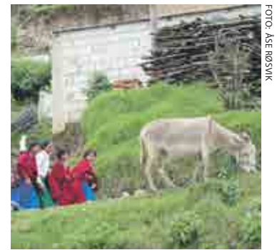
Ungdommer vil på skole.

Når ungdommen blir spurt om de skal fullføre ungdomsskolen, er svaret oftere ja enn nei. Det har helt klart skjedd en holdningsendring på dette feltet – både blant foreldre og barn.