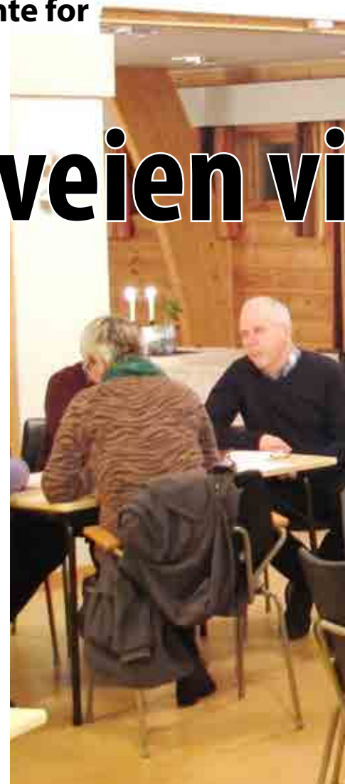
Viktige spørsmål om Normisjons fremtid

Regionstyret startet i 2013 en prosess med ny handlingsplan for Normisjons arbeid i Østfold. Ønsket var å tydeliggjøre våre fokusområder og hvordan vi arbeider best i årene som kommer. Etter litt tid ønsket vi flere stemmer inn i dette. Regionleder tok da initiativ til en serie områdemøter for å få en mer oppdatert situasjonsrapport fra medlemmer og foreninger. Med ønske om å utfordre foreningsapparatet på «hvor