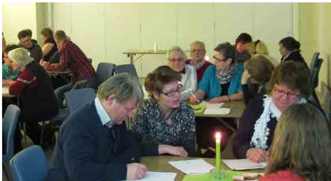
Samtale rundt bordene på områdemøtet i Rakkestad.

sken trykker», og bevisst jobbe for å få Normisjons medlemmer i tale. Tanken var en serie møter med tydelig fokus på dialog mer enn monolog. Det ble sju områdemøter fra januar til mars. Serien er, når dette skrives, akkurat ferdig. Til sammen har over 170 personer har vært med på disse samlingene! Nå gjenstår oppsummering, men mye har vært gjenkjennelig i alle samlingene. «De 4 B er» har flere startet sine oppsummeringer med. Levende kristne fellesskap