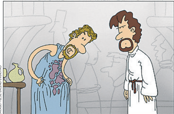
«ER DET NOEN SJANSE FOR AT DU KUNNE GJØRE EN SKVETT AV VINEN OM TIL VANN IGJEN?»