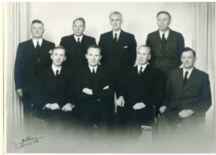
Styret for Vestre Borgebyssel krets av Indremisjonen 1947-48.