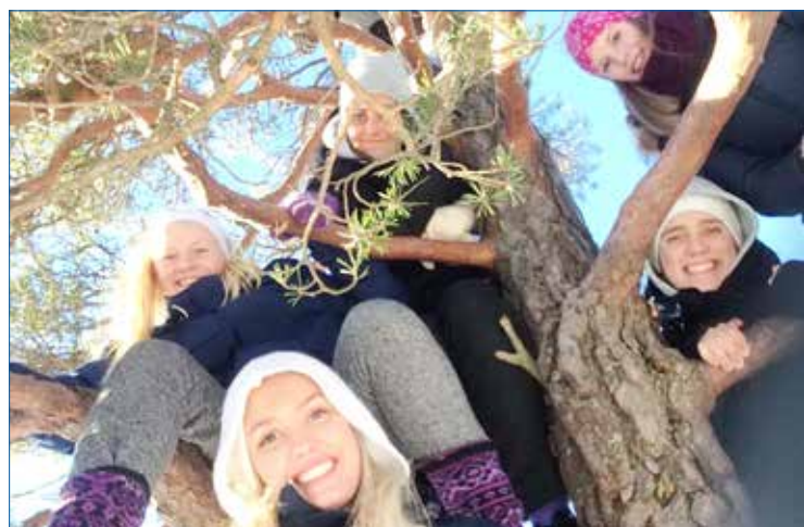
Her er et knippe av årets elever, blide og fornøyde ute på tur og oppe i trærne!

Mens høstsemesteret er spennende fordi vi skal bli kjent med nye elever, er vårsemesteret spennende fordi vi skal ta opp elever for neste skoleår. Konkurransen om elevene er stor, og vi lurer alltid på om vi kommer til å få full skole. De siste årene har vi vært så heldige at skolen har vært full ved skolestart, og det betyr svært mye for økonomien.