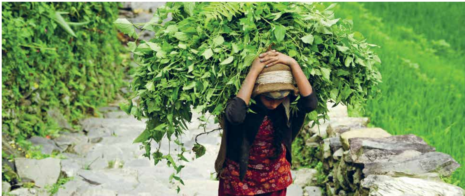
Kvinner bærer ikke bare tunge lass på ryggen i Nepal. De blir også i stor grad diskriminert.