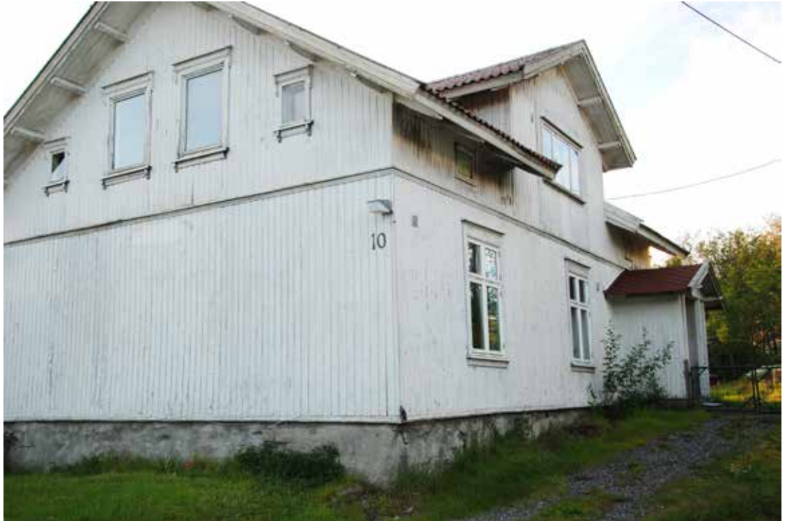
Mossik bedehus er nå solgt. Bildet er tatt i sommer, etter at korset er tatt ned fra veggen.

Mye har skjedd med huset gjennom årene. I 1976-77 ble det bygd et tilbygg som rommet lillesal, kjøkken og to wc. For å bedre økonomien etter utbyggingen ble Stjernen Misjonsforening tilknyttet NLM medeier i huset. I 1987 ble storsalen pusset opp. Det har vært stor virksomhet på Mossik bedehus gjennom årene, blant annet misjonsmøter, søndagsskole, yngreslag, musikklag, ungdomsforening