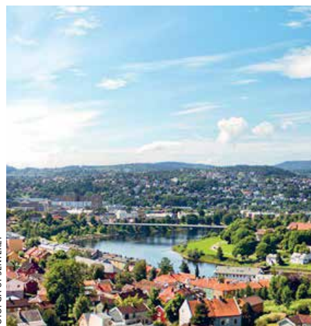
Staben i Trondheim gjør seg klar for å ta imot første kull til GUS Trondheim.