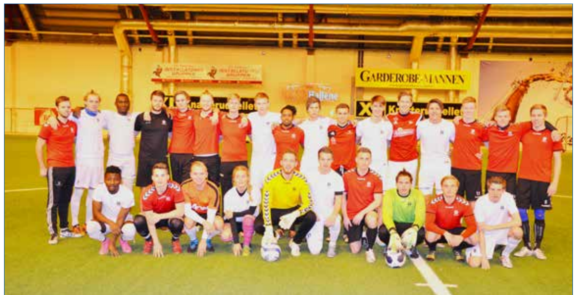
Reunion på Haugetun

ting og mimring over fjorårets begivenheter. Elevene hadde mange gode minner fra året på skolen, og da rektor spurte om det var slik at de kunne tenke seg å anbefale skolen vår til andre, fikk vi et hav av hender i været som tegn på at det ville de gjerne.