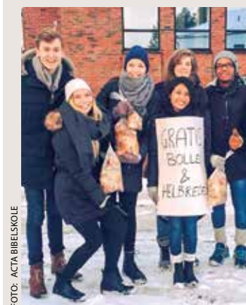
Her er Acta bibelskole på teamtur i Sandefjord.

Tsjekkia er nytt praksisland på Gå Ut Senteret i Trondheim.