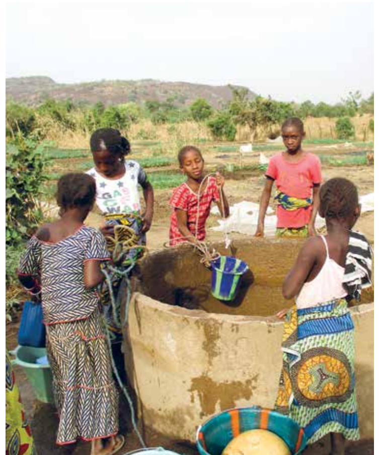
Rent vann er viktig for helse og utvikling i lokalsamfunn.