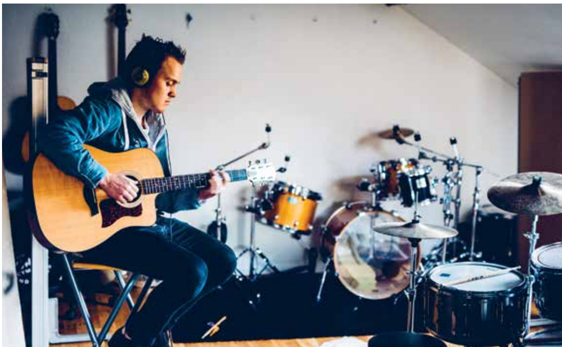
Bibelskolen i Grimstad tilbyr fordypning i musikk. Acta IMI kirkens Bibelskole i Stavanger tilbyr en populær lovsangsskole.

Mer informasjon, gode råd og tilbud på kniftrygghet.no , eller ring 23 68 39 00