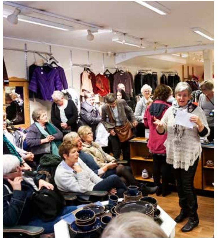
Medarbeidere fra de ni butikkene rundt omkring i landet hadde tatt turen til Drammen på fagdag for Galleri Normisjon.