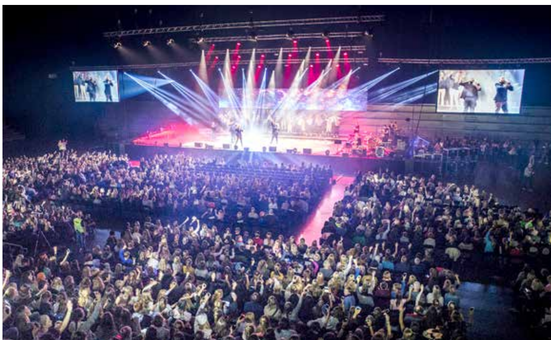
Det ble Soul Children-fest i Oslo i oktober. Neste festival er 26-28. oktober 2018.