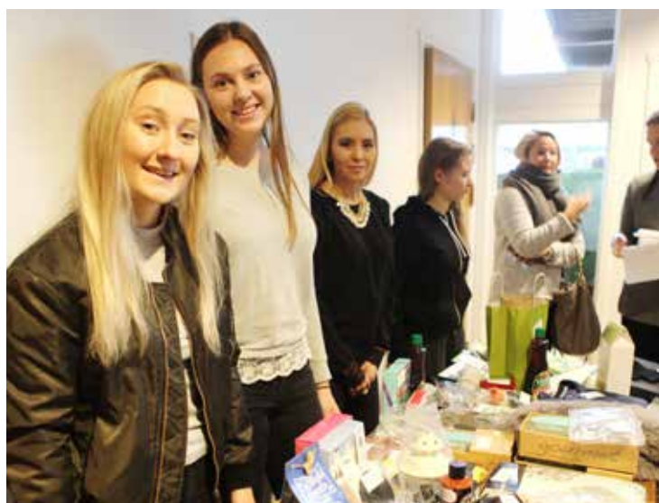
Her er loddsalget i full gang

Haugetunmøtet blir søndag 19. mars - på ettermiddagen - med besøk av sangeren Trygve Skaug. Noter dagen. Nærmere program kommer i neste nummer.