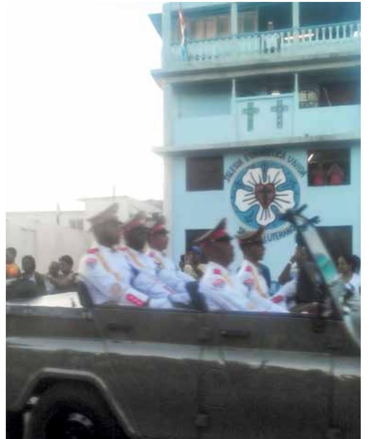
Militære æresvakter fører urnen forbi Den lutherske kirke i Santiago by.