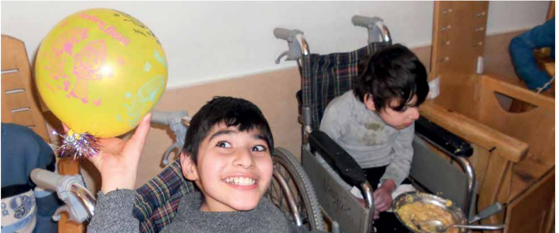
Ballonger var en populær gave under julefeiringen. Det er ikke alltid det er så mye som skal til for å sette litt mer farge på hverdagen.