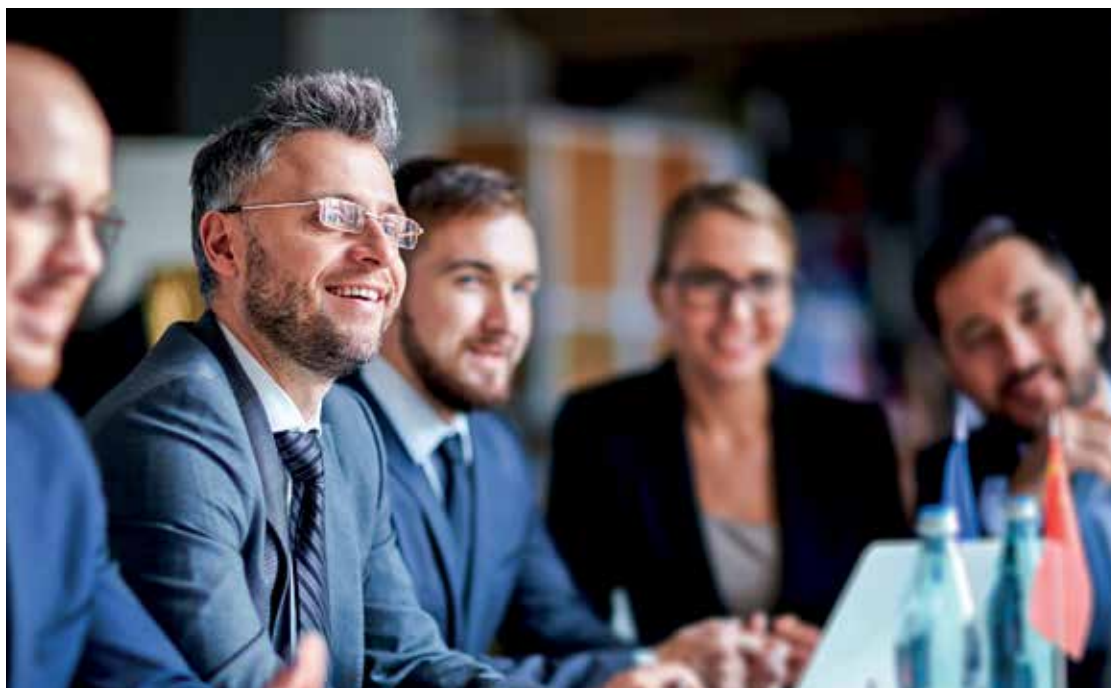
CBMC Norge ønsker å styrke norske kvinner og menn i rollen som Jesu disipler i næringslivet.