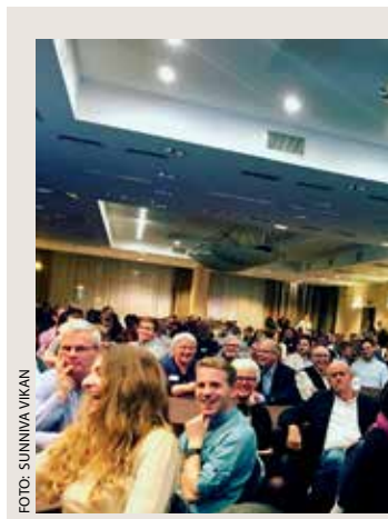
Normisjon ser fremover