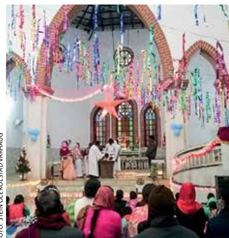
En familie på syv lot seg døpe i slutten av januar i Dumka.

Menighetsbygging/evang. i India Prosjektnummer: 114 97 963 Konto: 1503 02 13537