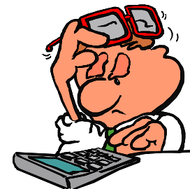
Gaveinntekter pr april

Alt i alt er dette en resultat-utvikling som forventet, men vi håper at vi sammen kan arbeide for bedre tall. Vi vil derfor minne om utfordringen til fast givertjeneste som ble lansert på årsmøtet.