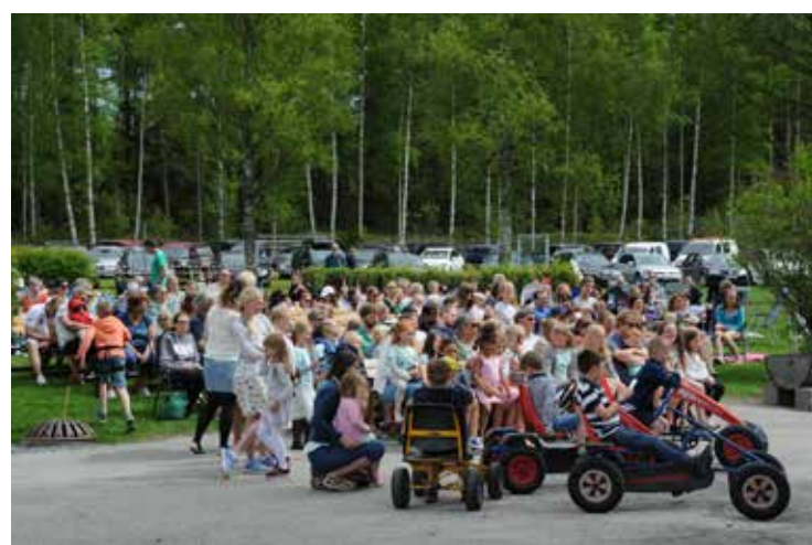
På Familiefestivalen var det godt vær og fin stemning.