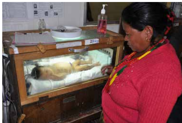
Enkle kuvøser gjør likevel sin tjeneste og redder liv.