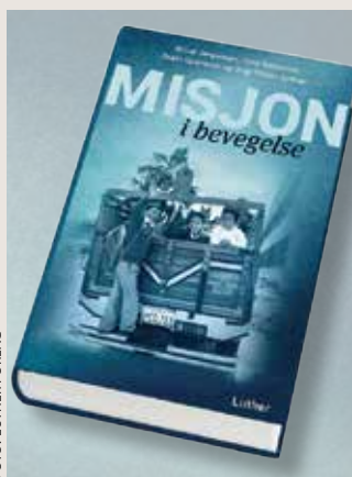
Jubileumsboka «Misjon i bevegelse»

” Dette er en måte å nå ut til andre enn de vi treffer med det vi allerede gjør