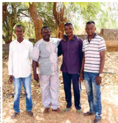
De tre studentene som nå går ut i praksis, sammen med rektor.

Prosjektnummer 401 021 Konto 1503.02.13537