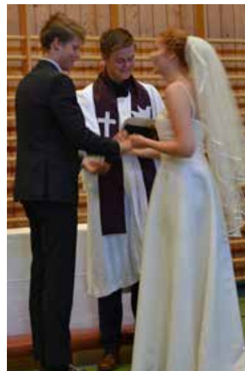
Her er brudeparet og presten i gang med «vielsen».

Søndag 13. mai fant den høytidelige avslutningen sted