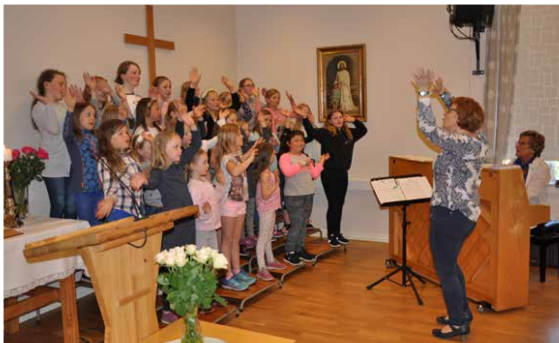
TRØKK: Barnekoret Ekko sang under den hyggelige tilstelningen.