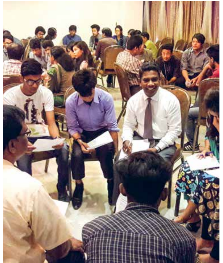
Det har vært mellom åtti og hundre ungdommer på de første samlingene i Dhaka Youth Fellowship.