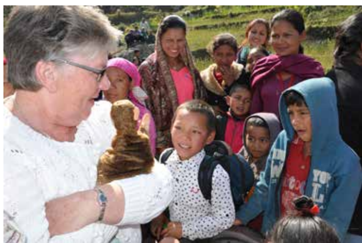
Jocko er i virksomhet både i inn- og utland. Her i Nepal.

☺ Det er lurt å skrive feriedagbok. Jeg kan ikke skrive, så da spør jeg om hjelp.