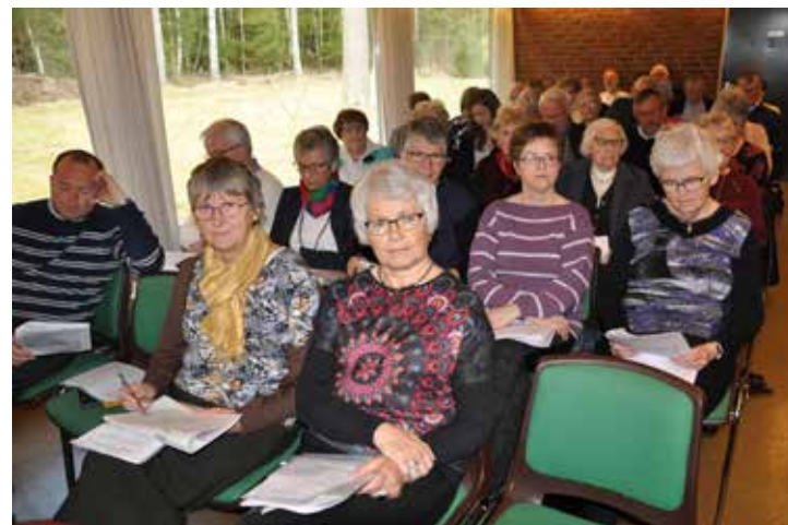
Utsnitt av deltagerne på årsmøtet.