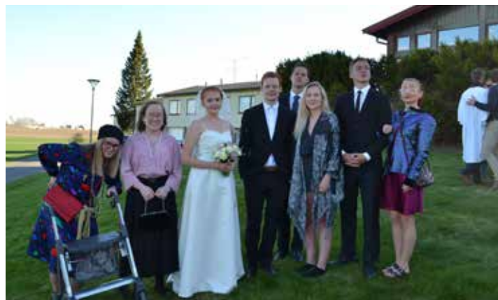
Brudeparet og nærmeste familie i noe spesielle bryllupsklær!

i gymsalen som var fylt av foreldre og andre familiemedlemmer. Et felleskor bestående av alle elevene bidro virkelig til at dette ble en fin stund. Mange hadde en lang dag med utbæring, lasting inn i biler, fotografering, avskjed og ikke ubetydelig med tårer.