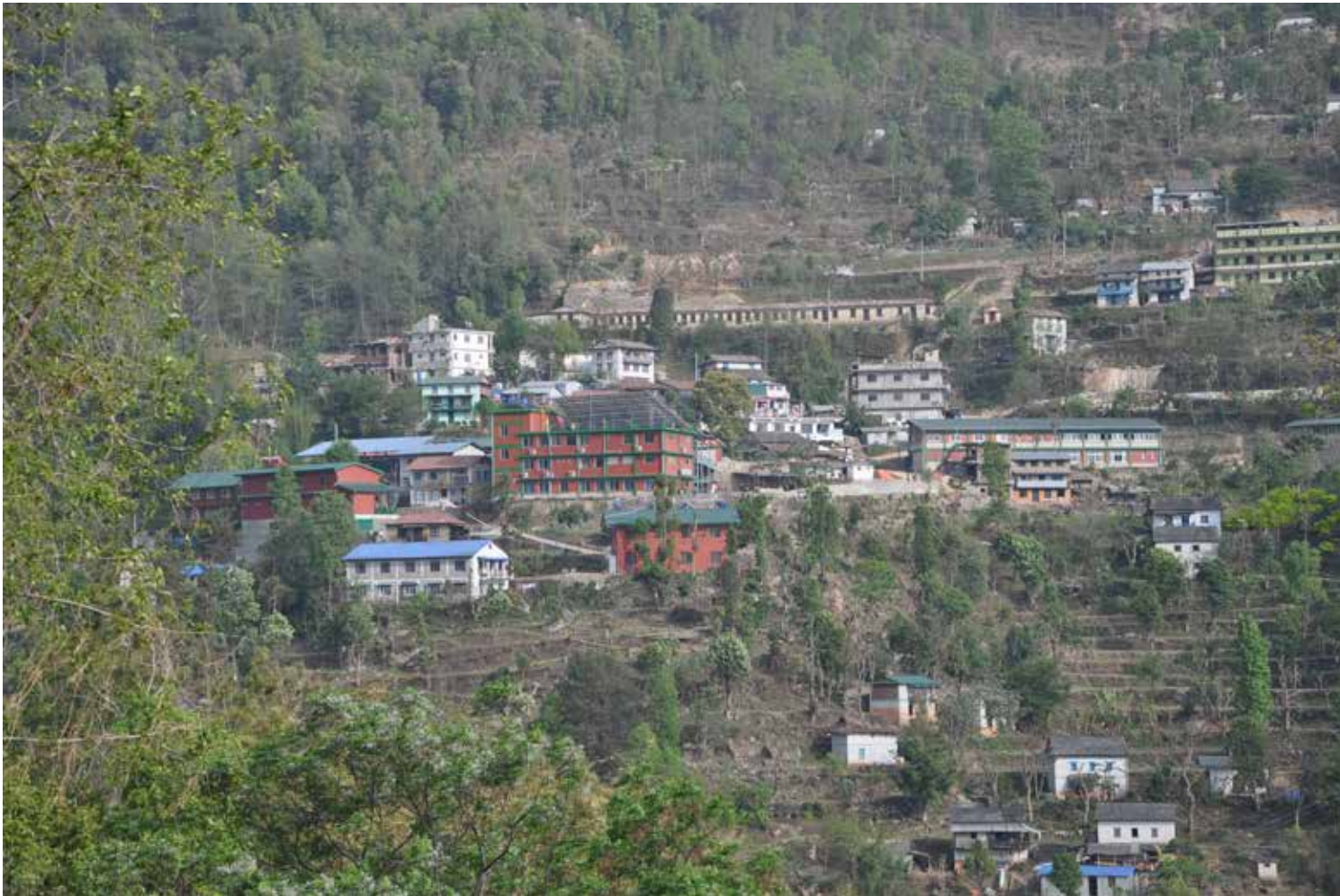
Okhaldhunga sykehus består av mange bygninger. Sykehuset dekker et fylke på 200 tusen mennesker, pluss tre nabofylker.