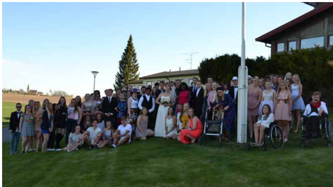
Hele Haugetunfamilien samlet på plenen.

De siste dagene før avslutningen var nærmest skoleåret i et nøtteskall når det er snakk om variasjoner i alt som skjer i løpet av de 33 ukene elevene er på Haugetun. En gjeng var i Sverige og opplevde spenningen ved fallskjermhopping, og i ett døgn var deltagerne i Ironman-konkurransen i aksjon på og i området rundt skolen. Ulike oppgaver og aktiviteter krevde mye både fysisk og psykisk.