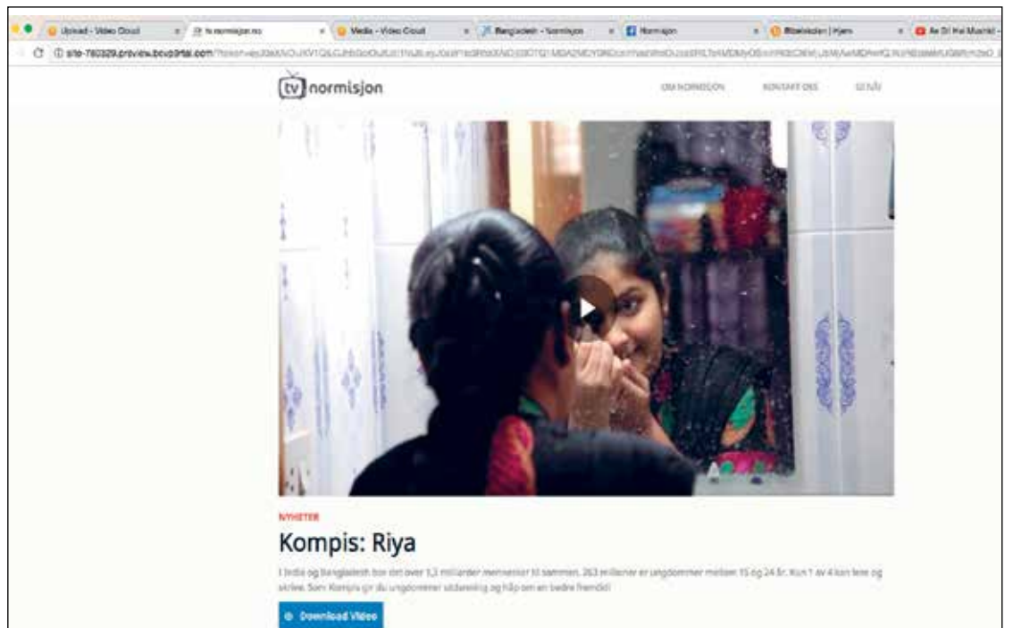
Slik ser den nye videoplattformen ut ( tv.normisjon.no )