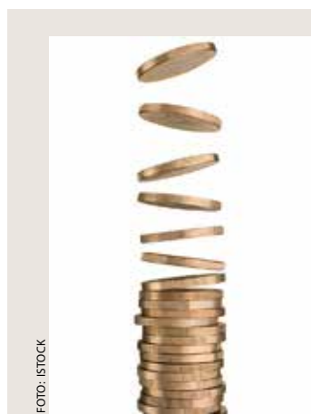
Normisjons økonomi blir stadig bedre.