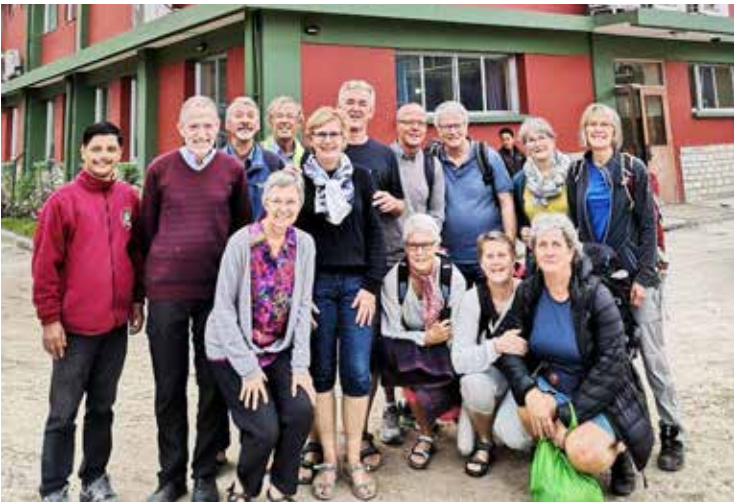
Hele gruppa

Normisjon Region Østfold inviterte igjen til en tur til Nepal, for å se og oppleve et spennende land, men også for å besøke og lære noe om de prosjektene vi er med og støtter. Dette var den sjette turen til Nepal siden 2003. Alle ni som var med fikk gode opplevelser og sitter igjen med mange minner etter turen.