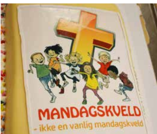
FEST: En flott marsipankake fikk ben å gå på under festen.

I hele 80 år har barneforeningen «Mandagskveld» (tidligere Trømborg yngres) vært i virksomhet. Det ble det stor fest av! Omlag 150 mennesker var med å markere jubileet i Trømborg. Mandagskvelden startet med gudstjeneste i Trømborg kirke og fortsatte