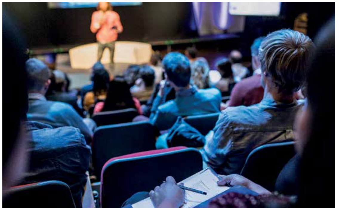
Det er duket for konferanse for bredden i Normisjon. Her skal organisasjonens fremtid formes, mennesker møtes og ideer utveksles.