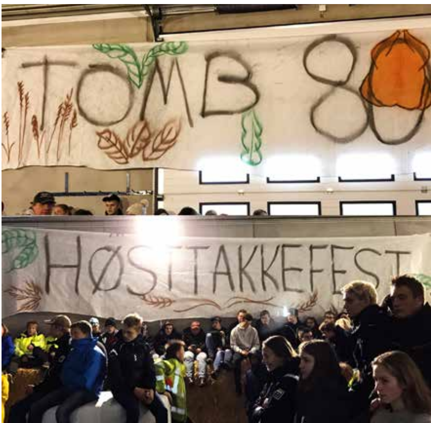
Elever og ansatte feiret høsttakkefest og 80 års bursdag 15. oktober.

videre ble feiret med bursdagssang, line-dance og potetsuppe, inspirert av oppskrift fra Ecuador. Og selvfølgelig er ikke en høsttakkefest over, før det blir framført en takkebønn for innhøsting, mat og grøde - og følgende bordvers sunget: «Herre din jord bærer mat nok for alle, takk for den delen du vil vi skal ha, Lær oss å dekke et langbord i verden, som alle kan reise seg mette fra!»