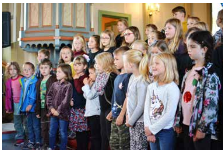
SANG: Barneforeningen «Mandagskveld» synger under gudstjenesten i Trømborg kirke.

I hele 80 år har barneforeningen «Mandagskveld» (tidligere Trømborg yngres) vært i virksomhet. Det ble det stor fest av! Omlag 150 mennesker var med å markere jubileet i Trømborg. Mandagskvelden startet med gudstjeneste i Trømborg kirke og fortsatte