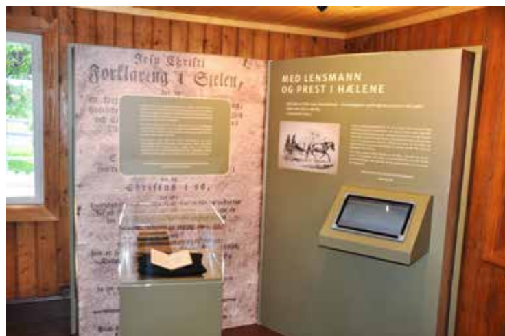
Inne i det nye besøkscenteret kan en både ved fysiske og digitale løsninger komme tett på Hans Nielsen Hauges liv og virksomhet.