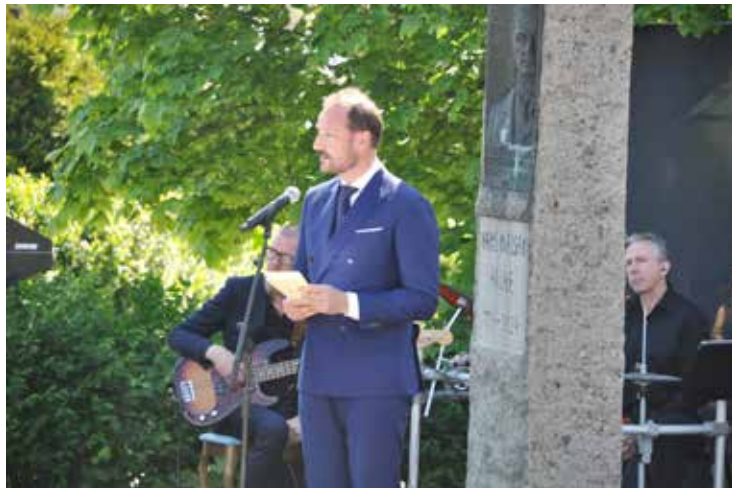
Kronprinsen talte og gratulerte. Talen hans finner du på Slottets nettside.

Fra 1957 har påbygget vært vaktmesterbolig, da tidligere vaktmesterbolig, som lå lenger borte på tunet, ble gjort om til bedehus. Det nye bedehuset Hauges Minde ble bygget i 1979 og utvidet ti år senere