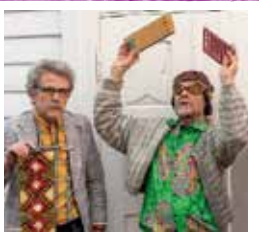
FORESTILLING KL. 13.15

Lun humor, viser og alvor omkring den viktige basaren og bedehuskulturen som var en bærebjelke i arbeidet og for det verdensvide kallet vi kristne har. Om både indre - og ytre misjon som ble Normisjon. Bedehusbasaren som selvsagt har gevinster!