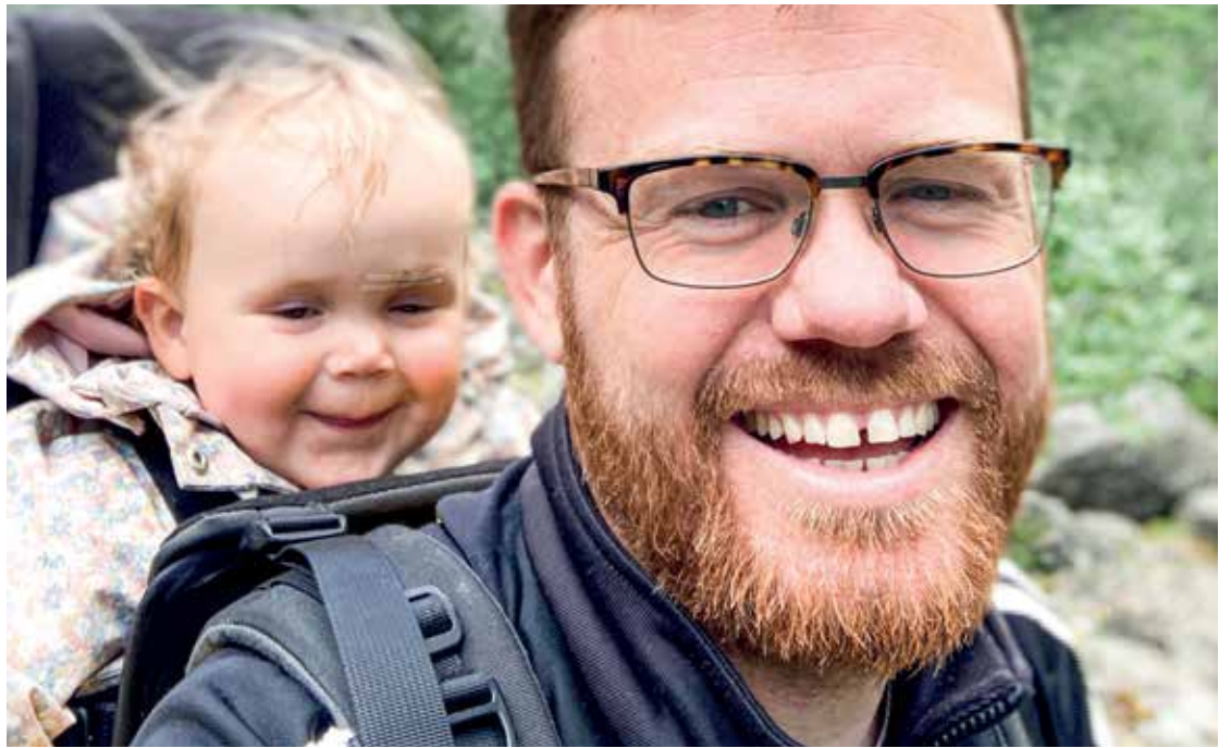
Pastor i Norkirken Vennesla i Agder oppfordrer til «Comeback med Gud».