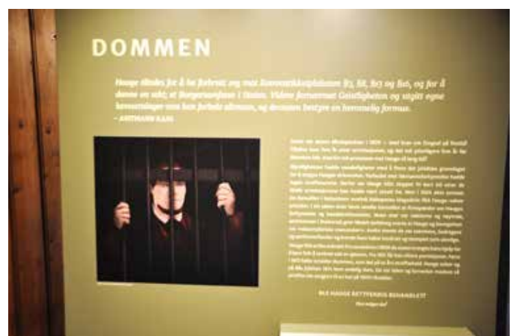
Hauge satt ca. 10 år bak lås og slå, og tidvis under svært vanskelige soningsforhold.