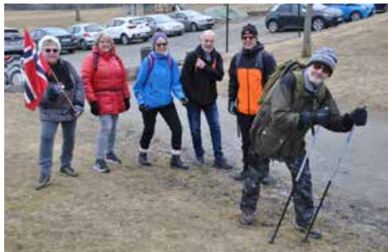
Fra en tidligere tur med «Nortråk».