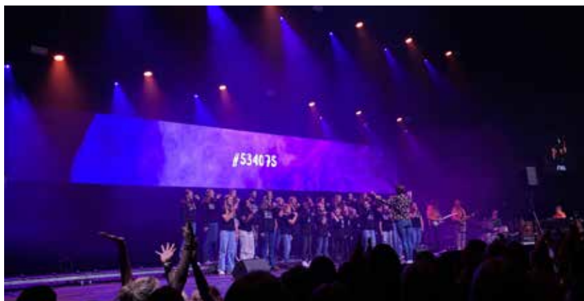
Korene Fredrikstad og Bjørnstad Soul Children på scenen under festivalen.