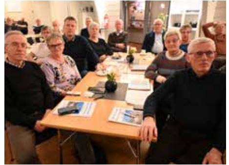
Utsnitt av deltagerne på årsmøtet i Normisjon region Østfold.