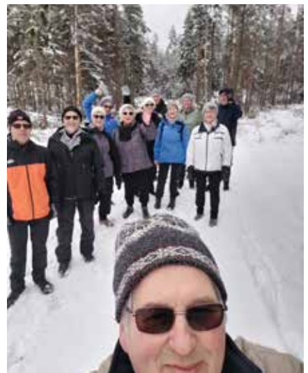
Et glimt fra turen i februar.