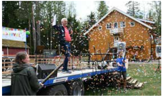
Jubileet på Sjøglimt ble tydelig markert.