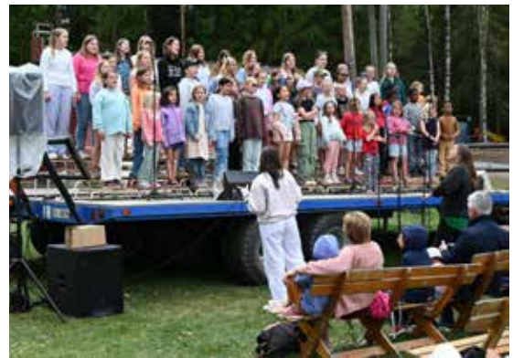
Sangen fra mange barn satte sitt preg på festivaldagen.