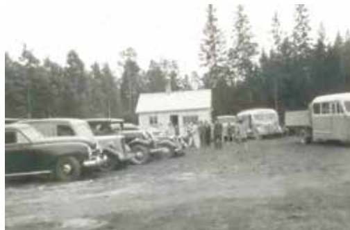
Se bilparken! Folk kom langveisfra for å være med på «eventyret» som Sjøglimt ble kalt.