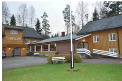
Slik ser Sjøglimt ut i nyere tid.

juni 1978. Flere større oppussings- og vedlikeholdsprosjekter har senere blitt utført, se egen sak. Gjennom årene har flere titalls tusen mennesker vært på leir på Sjøglimt. Bare i løpet av de første 20 årene deltok 16.500 på kretsens egne leirer, i tillegg til alle som har vært på leirskole, konfirmantleirer, menighetsweekender og andre utleiearrangementer.