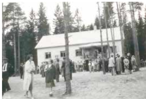
Fra innvielsen 5. juli 1953 med 8-900 mennesker tilstede.