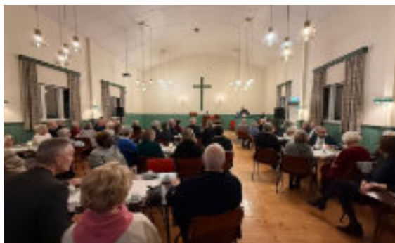
Et glimt fra avslutningsmøtet.

Vi kan også nevne felleskomiteen. Vi har hatt et godt fellesskap på tvers av menighetsgrenser, også Frelsesarmeen etter at de flyttet til byen.